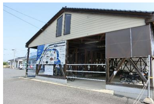
(荒島駅前自転車駐車場)