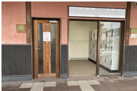
R2年度コインロッカー増設(旧ATMコーナー)