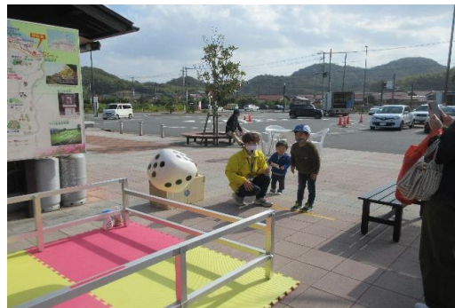
ジャンボサイコロゲーム（毎月）