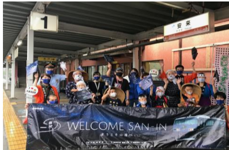
観光列車「銀河・あめつち」出迎え風景