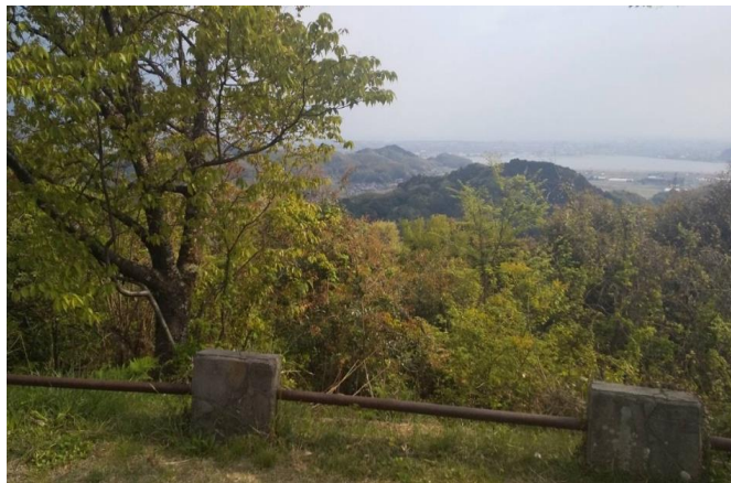
清水公園展望台からの眺望