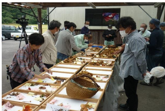
きのこ狩りの集い