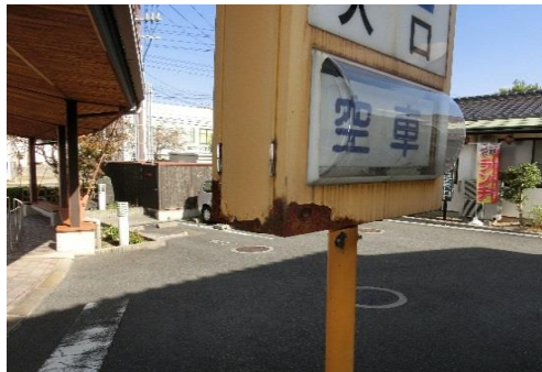
コインパーキング表示機の腐食