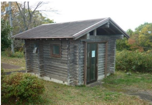
子ども広場トイレ外観