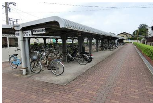
(安来駅前自転車駐車場)