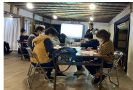
起業スタートアップサロン