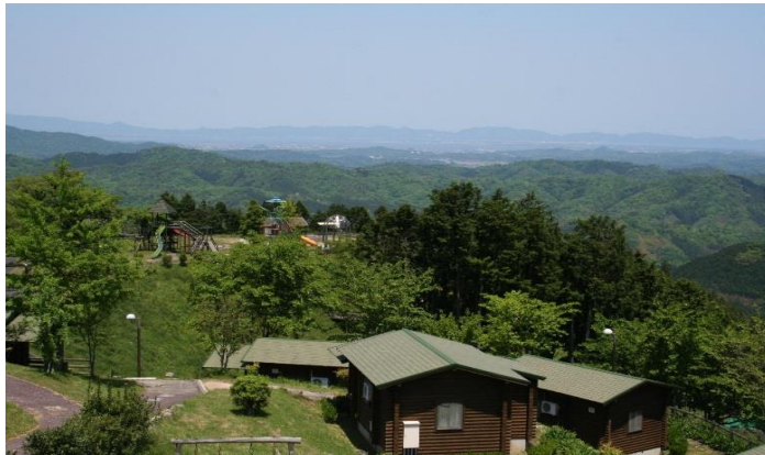
上の台緑の村からの眺望