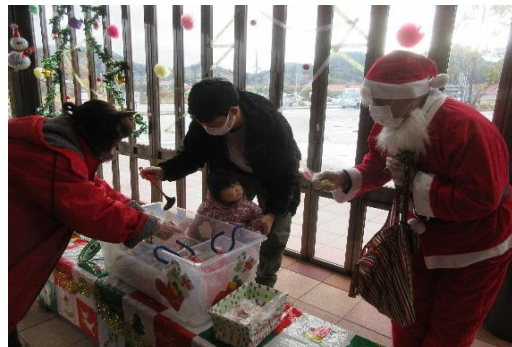
クリスマスイベント（12月）