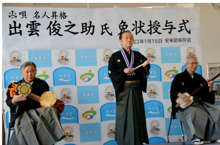
R3. 1. 15安来節名人の免状授与式・唄の披露（安来庁舎）