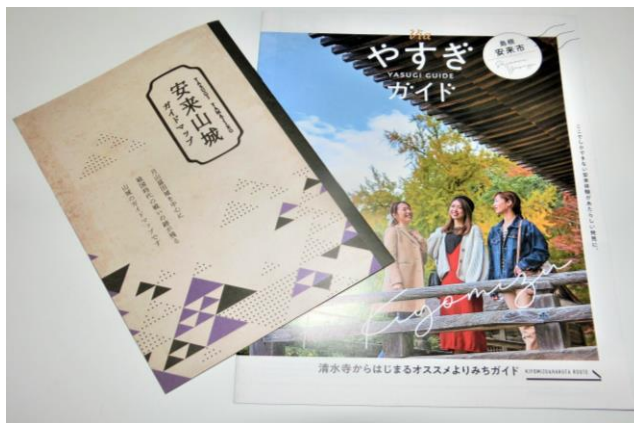
「総合パンフレット、山城ガイドマップ」