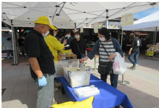
新米とまいもん祭り（10月）