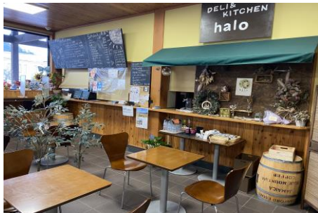
R2. 6月館内喫茶リニューアル

指定管理委託料 17,076,000円 観光案内業務委託料 5,700,000円 その他施設維持修繕費外 1,642,000円