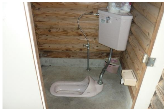
子ども広場（女子トイレ/和式）