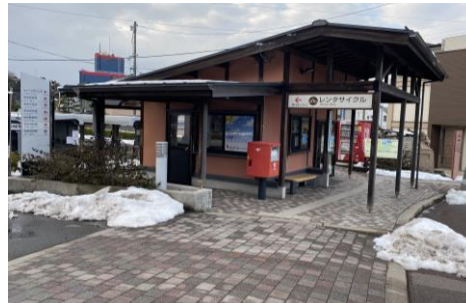
駐輪場管理棟・レンタサイクル受付