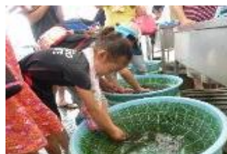
まちゼミ開催の様子