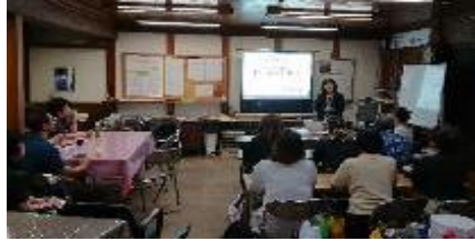
起業家サロンの様子①