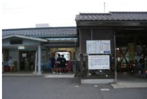
荒島駅前自転車駐車場