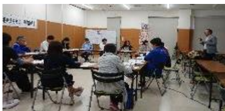
アドバイザーによる勉強会の様子