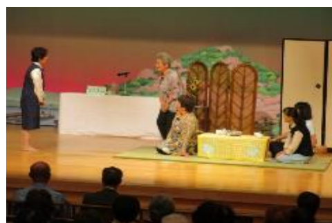
悪質商法被害防止の啓発劇