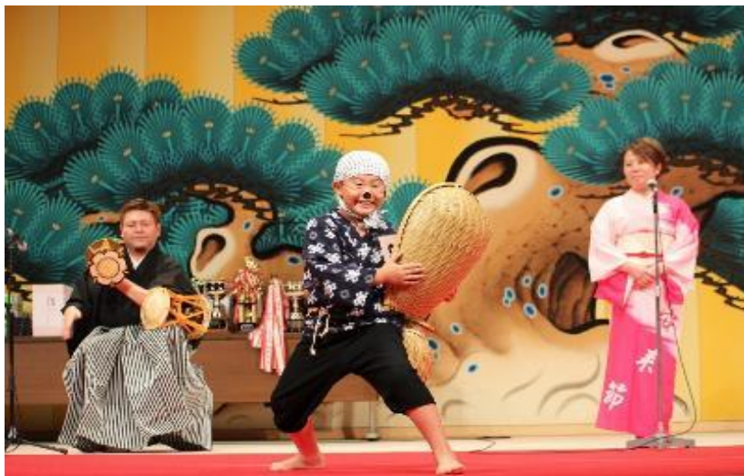
平成30年度安来節全国優勝大会（少年の部）