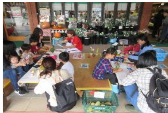
子ども向けイベント