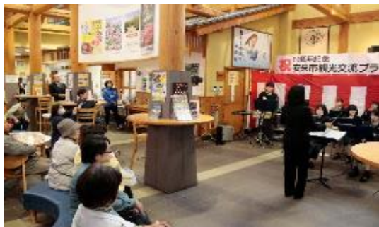
オープン10周年記念イベント