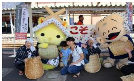
「安来駅盛り上げ隊」とJR安来駅の連携による観光客お出迎え