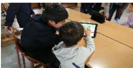
情報高校連携事業の様子