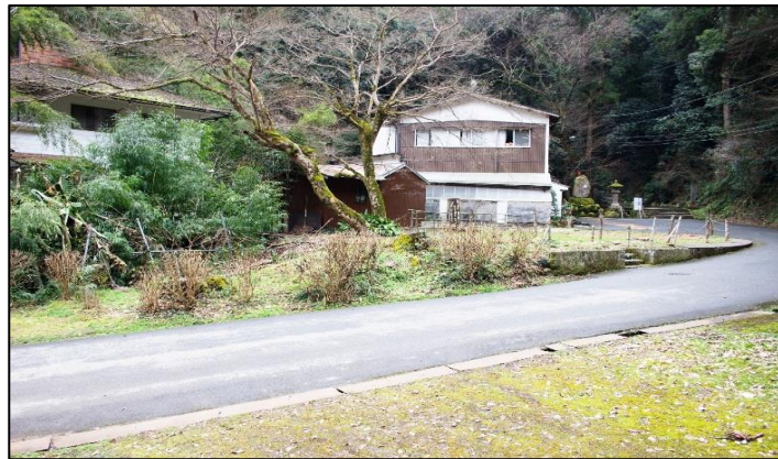
整備予定箇所の現況写真