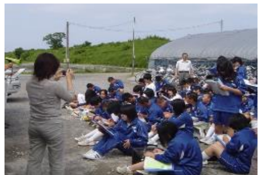
児童生徒の課外活動(於：どじょうセンター)