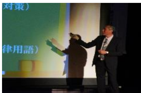
弁護士の啓発講演