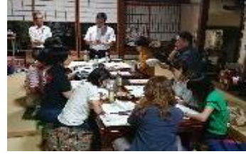
起業家サロンの様子②