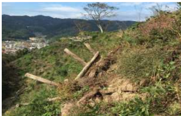
園路の盛土を支える木柵が崩壊

鳥取県中部地震により被災した史跡富田城跡三ノ丸園路の災害復旧を行う。平成29年度は復旧方法の検討を行い、実施設計を策定し、一部復旧工事を実施する。