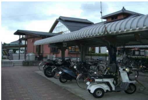
(安来駅前自転車駐車場)