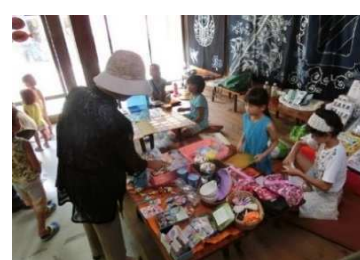
(ワイワイきっずフリマ)