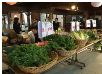
(やすぎ神在月まつり)