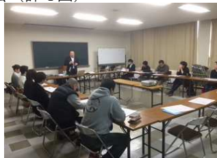
(アドバイザーによる勉強会の様子)