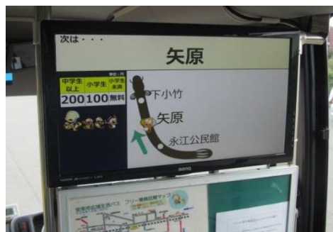
バス車内の降車案内表示盤