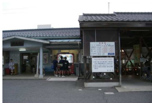
(荒島駅前自転車駐車場)