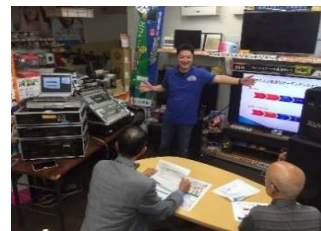
(第1回まちゼミの様子)