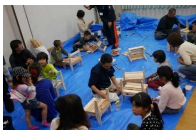
(やすぎエンジョイチャレンジ)