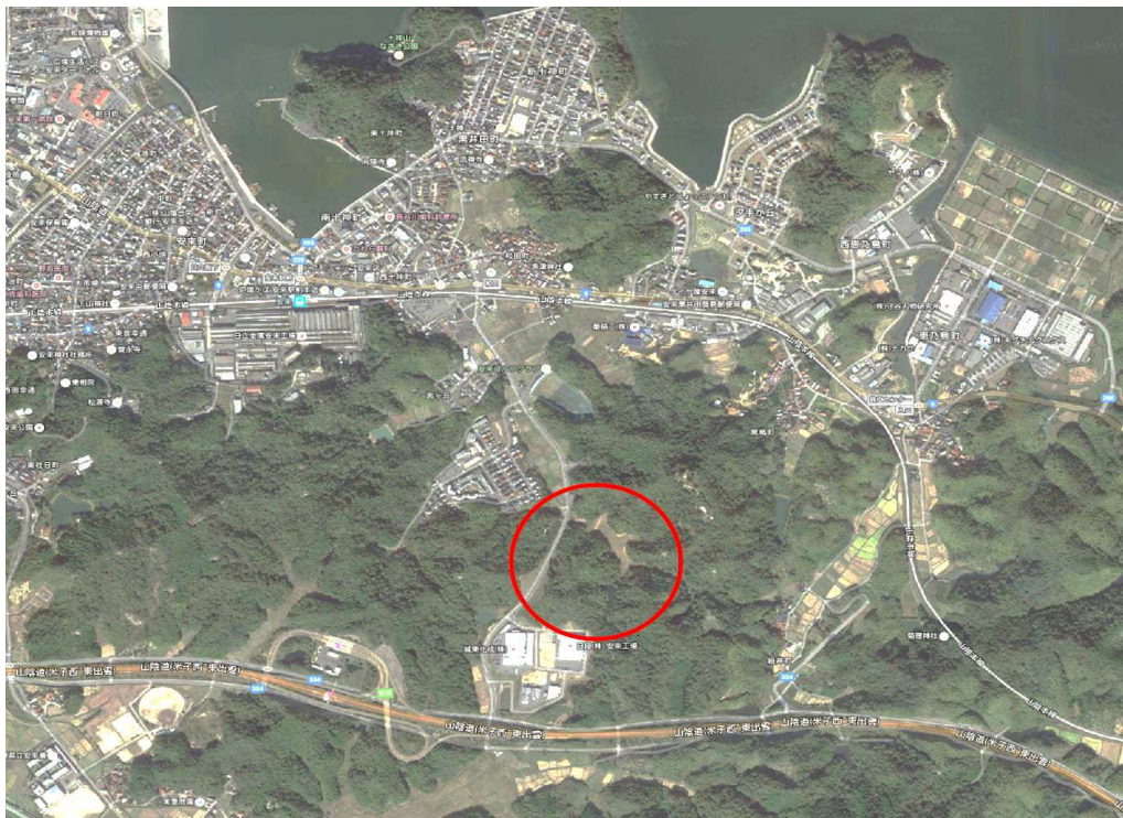
(新工業団地造成予定地 位置図)

新たな工業団地の整備に向け、調査設計、測量調査を行い、具体的な整備計画を策定を進めるとともに、事業主体である安来市土地開発公社に対する事務費等の負担と用地取得にあたっての借入金の利子補給を行う。