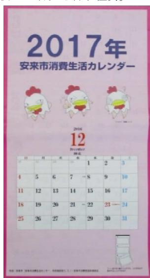
2017消費生活カレンダー