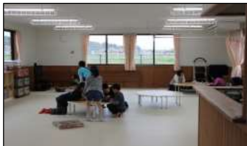
放課後児童クラブでの日常風景