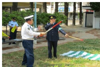
安来市交通指導員 初任者研修会