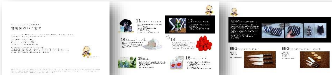
ふるさと寄附パンフレット