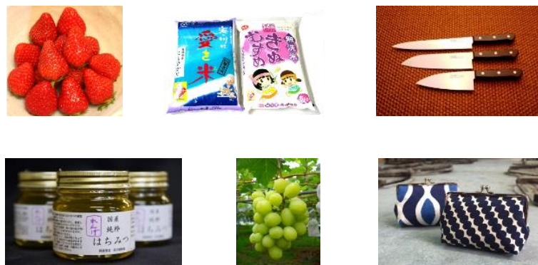
人気返礼品・新規追加返礼品