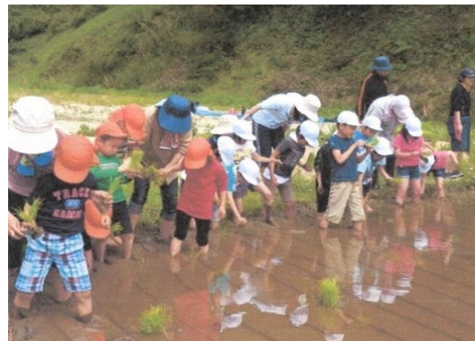
栽培活動地域元気アップ事業 田植え