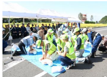
〈防災訓練に参加した自主防災組織〉

自主防災組織・・・組織数 35団体 結成率 57% (平成27年10月31日現在)