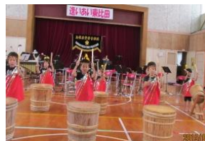
サマーフェスティバル 逢いあい東比田

【コミュニティ施設整備支援事業】 4,000,000円 0円 0円 4,000,000円 0円