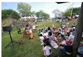
食・音・ふれあいin 上の台緑の村

市民が中心となった人づくり、まちづくり、文化振興事業等に対し補助金を交付する。 事業を審査するため、安来市地域トライアングル事業補助金審査委員会を年4回開催する。 限度期間：3ヶ年、補助率：2/3（地域文化・歴史記録保存事業は1/3）、限度額：1,000千円