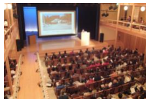
自主防災活動研修大会