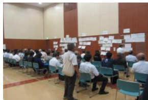
中山間地域研究センターで 開催された地方創生特 別研修

自治会代表者協議会に対して交付金を交付し、地域コミュニティの構築や育成にむけて研修会や地域づくりの事業等を実施し、自治会活動の推進を図る。