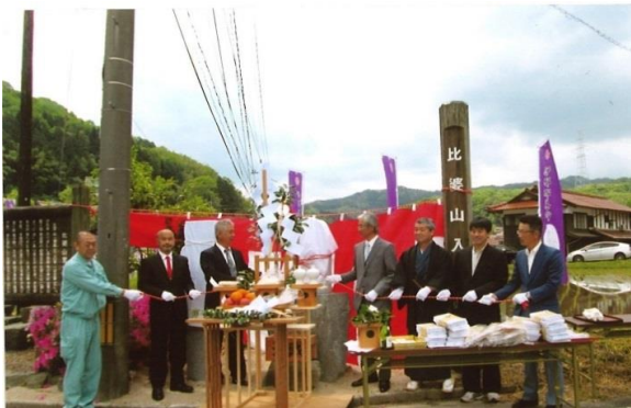
温故知新・文化伝承地域活動事業 伊邪那美命像建立