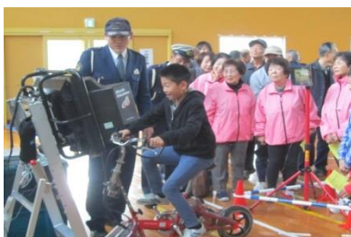
子どもと親・高齢者世代間交流交通安全教室 (荒島小)