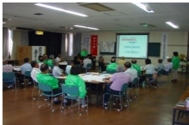
〈安来市防災指導者講習会の様子〉