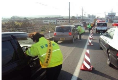
交通死亡事故多発警報発令時 啓発活動