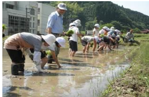
地域の方と年間を通じて米作り（母里小）