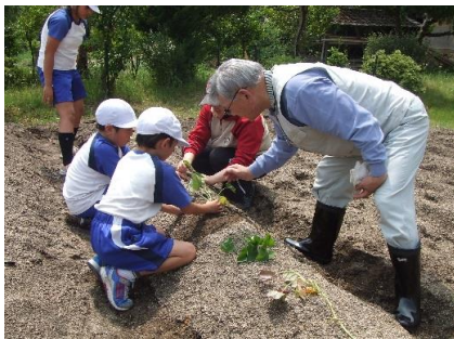
■学校支援活動「芋苗植え」