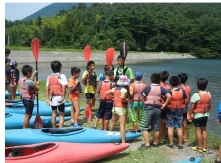
■やすぎ子ども探検隊「大山自然体験」

社会教育活動に携わる社会教育主事を雇用し、「子ども探検隊」を中心に青少年教育を実施する。 学校・地域・家庭の連携と地域教育力の向上を図るために、社会教育委員の会を開催する。