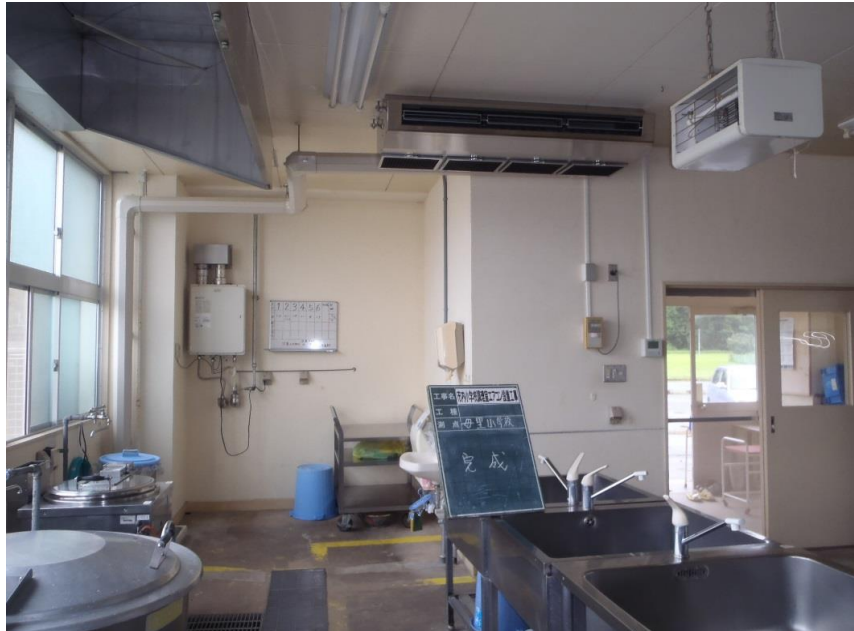
（調理場エアコン設置工事）

衛生管理上、調理室内は温度が25℃以下、湿度は80%以下に保つように努めることとされているが、調理室内が6月でも調理場内の温度が30℃以上になり、夏場になるとさらに過酷な状況となる。温度・湿度を管理することが、食中毒のリスクを排除する上で最大の手段であり、労働安全衛生上必要である。計画的に調理場にエアコンを設置する。