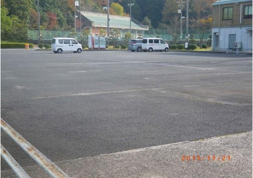
安来運動公園駐車場