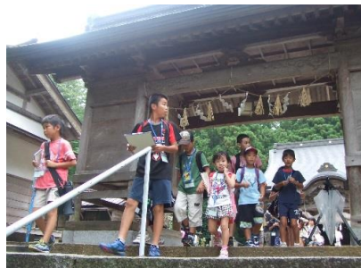
■放課後支援活動「金屋子探検」