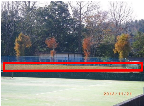
安来運動公園庭球場防球フェンス設置予定箇所（南側コート）