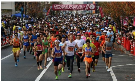
■ なかうみマラソン全国大会