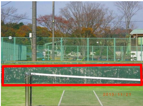
安来運動公園庭球場コート内壁改修予定箇所