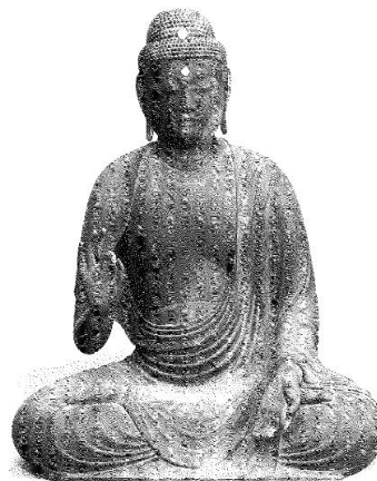
木造阿弥陀如来像