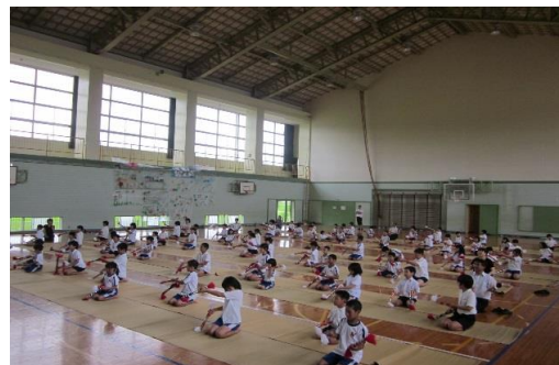
地域講師による安来節講習（能義小）