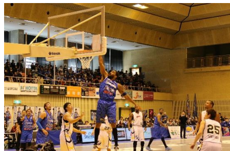
■ b j リーグ安来市大会