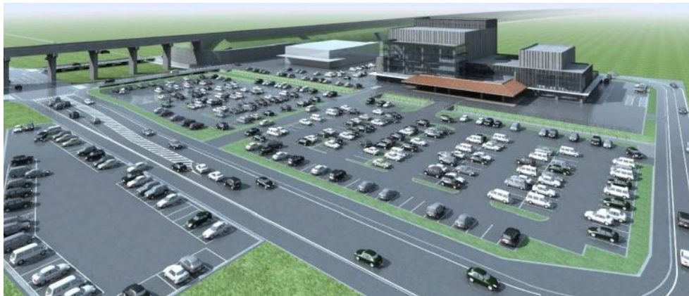
市民会館（仮称）のイメージ図

市民会館（仮称）開館後の管理運営のための実施計画を策定する。 管理運営計画策定委員会を開催する。