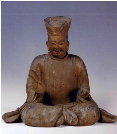
木造摩多羅神坐像