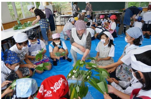
地域の方と笹巻きづくり（広瀬小）