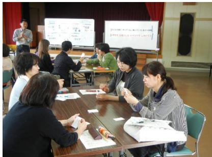
■人材養成講座「子どもを支えるスキルアップ講座」