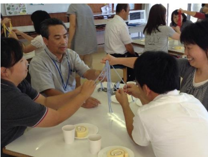
■家庭教育支援「親学プログラム」