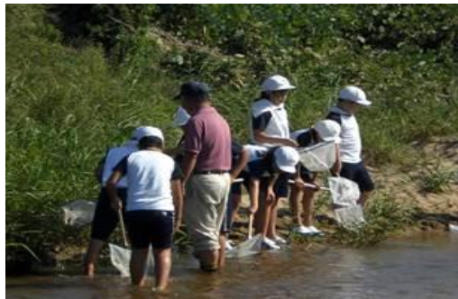
地域講師と川探検（赤江小）