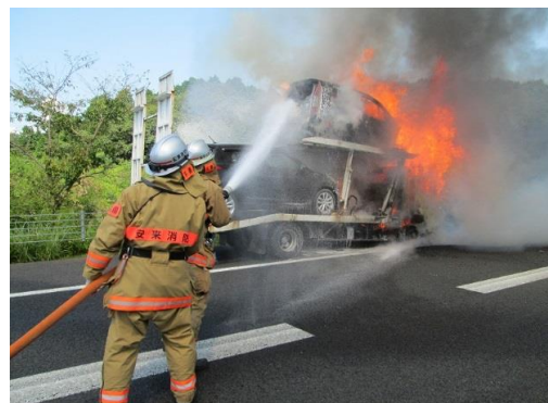
車両火災活動状況