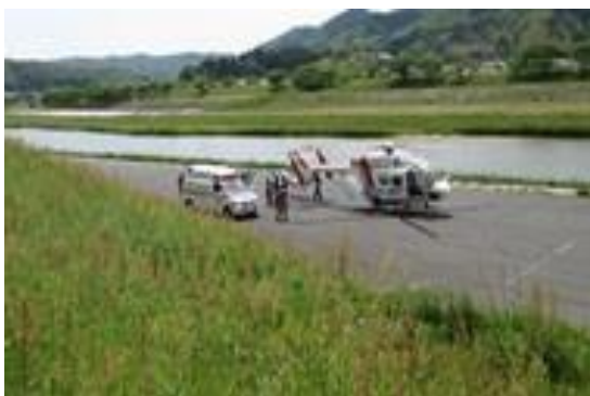
ドクターヘリによる搬送状況

・平成9年・10年度で整備した島根県防災情報ネットワークの衛星系設備を更新するもの。