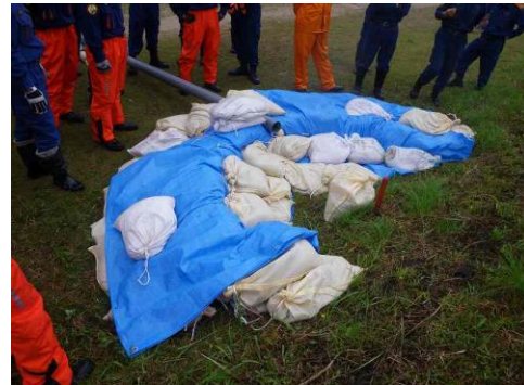
土嚢積み工法完成