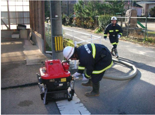
伯太方面隊秋季訓練

・消防車両の整備維持管理は、災害時の適切かつ迅速な対応を可能にするために必要不可欠で、市民の安全を確保するための基本となるものである。