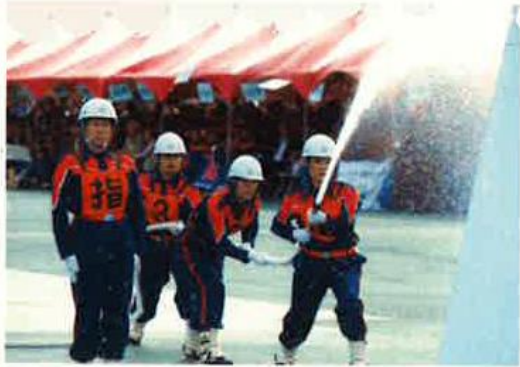
全国女性消防操法大会出場