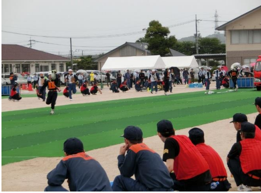
島根県消防操法大会