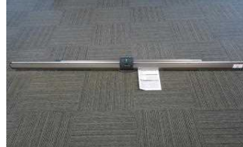
モバイルスクリーン