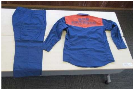
消防吏員用活動服 52着