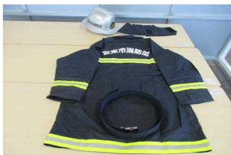
消防団員用防火衣 44着

【消防団員用器具購入事業】 2,609,200円 0円 0円 2,546,000円 63,200円