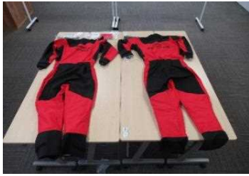
サーフェイスドライスーツ