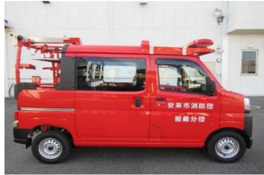
小型動力ポンプ付軽積載車（能義分団配備）