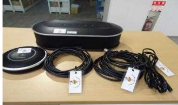
マイクスピーカー