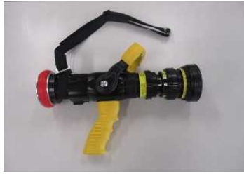
クールファイターノズル