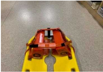
ヘッドイモビライザー