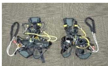
フルボディーハーネス