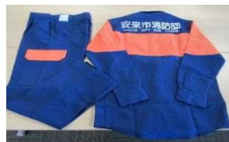
消防団員用活動服 40着