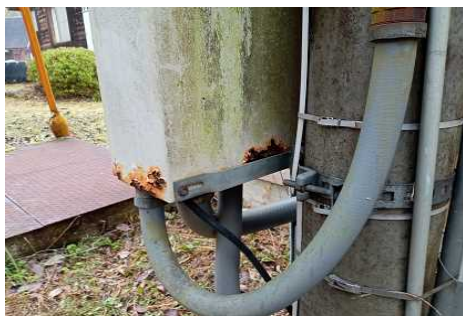
山佐ダム体験交流施設電気設備改修工事（施工前）