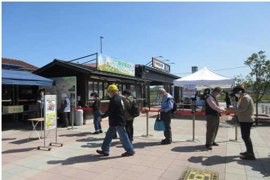
令和4年4月 11周年記念祭

会計年度任用職員報酬（駅長・事務補助員） 10,202,625円 共済費 1,573,366円 委託料（保守点検・清掃・イベント企画） 5,985,261円 その他施設維持修繕費外（光熱水費ほか） 15,268,677円