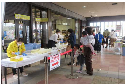
令和4年10月 新米とまいもん祭