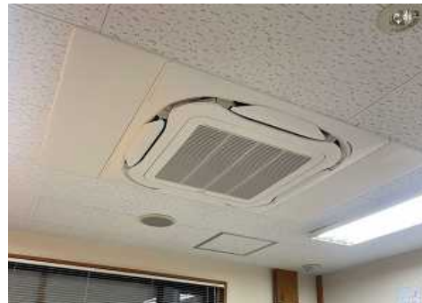
観光交流プラザ空調設備改修後