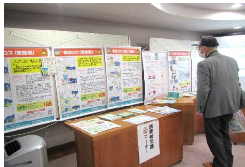
人権フェスティバルでの啓発展示の様子