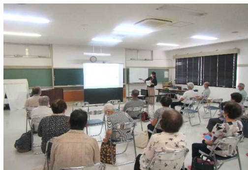
消費生活専門相談員による講座の様子