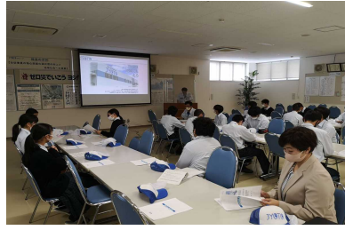
情報科学高校企業見学ツアー