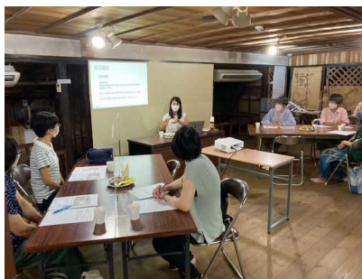
起業スタートアップサロン