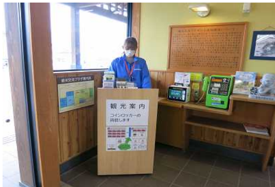
観光案内のカウンターを設置