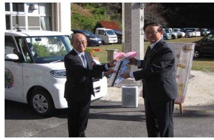
宇波地区自治会輸送車両貸与式

【コロナワクチン接種送迎事業】 13,677,120円 13,000,000円 0円 0円 677,120円