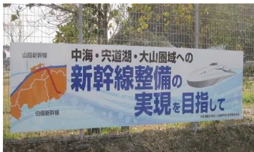
新幹線整備誘致看板