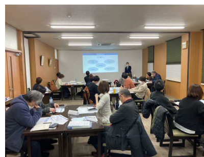
やすぎ起業家ミニスクール