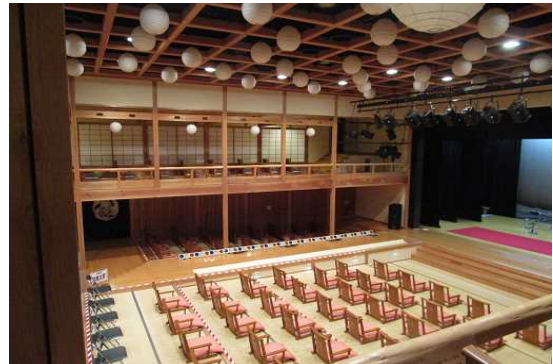
安来節演芸館（ホール内）