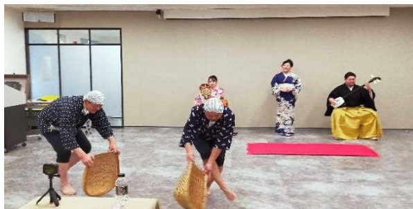
台湾新北市新店区 安来節公演

【安来節保存会補助事業】 2,516,000円 0円 0円 2,000,000円 516,000円 安来節保存会の行う安来節の普及宣伝や振興事業（唄い初め会等）に対し補助を行った。安来節全国優勝大会はコロナ禍により中止となったが、ビデオ審査会を実施した。また、台湾新北市新店区との友好交流都市覚書締結に出席し、新店区役所にて安来節公演を行い海外での安来節PRを行った。