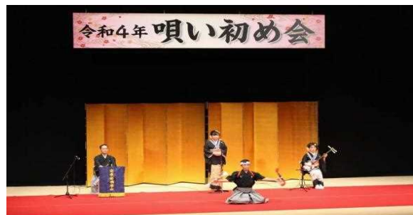
唄い初め会（アルテピア）