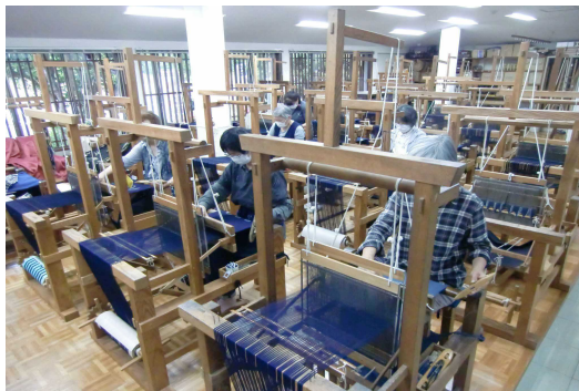
絣センターの利用風景