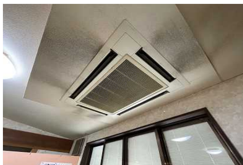
憩いの家空調設備改修前