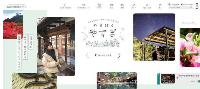
安来市観光協会ホームページ

【観光協会補助金事業】 32,829,000円 0円 24,000,000円 0円 8,829,000円 観光資源や観光地等の情報発信、関係団体との連携及び特産品販売の強化、観光協会各支部が実施する事業運営費として、安来市観光協会に補助を行った。