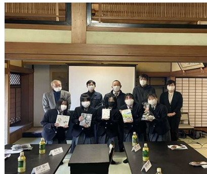
【独自事業】 情報科学高校生による ビジネスチャレンジ事業の様子