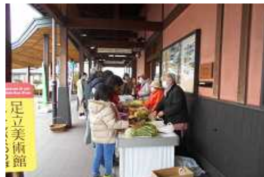
日曜朝市（第3日曜日開催）