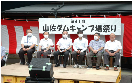
山佐ダムキャンプ場祭り