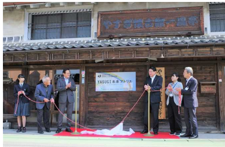
YASUGI未来アトリエオープニングセレモニー