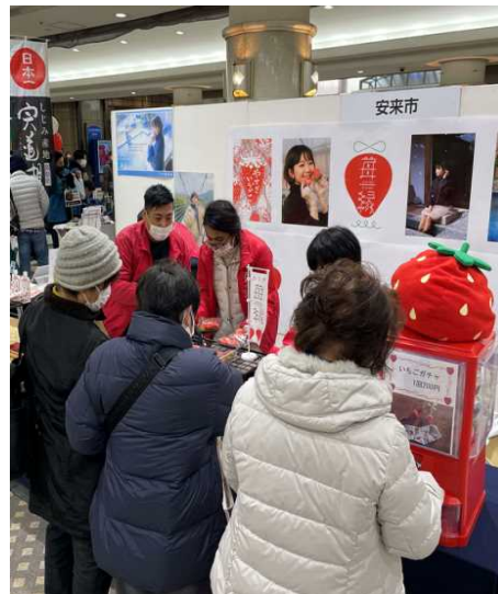
島根ふるさとフェア2022