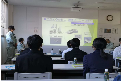
安来高校企業見学ツアー

開催日：令和4年10月5日、同年11月9日 参加学生数：190名 見学先：市内22事業所