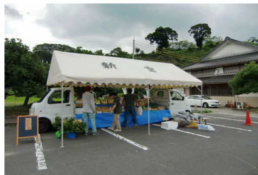
絣センター前でのイベントの様子