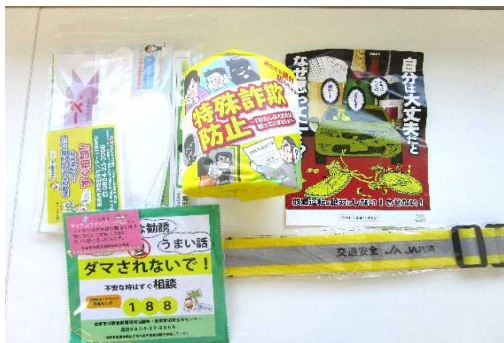
高齢者向け啓発物