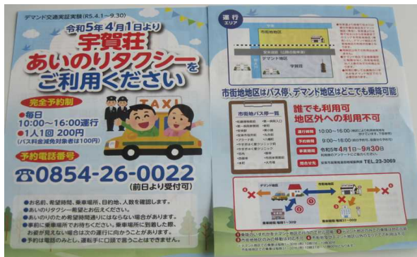
宇賀荘あいのりタクシー チラシ

令和5年度に実証実験を行う、宇賀荘あいのりタクシーのための事前準備（チラシ作成、受付用電話設置等）を行った。