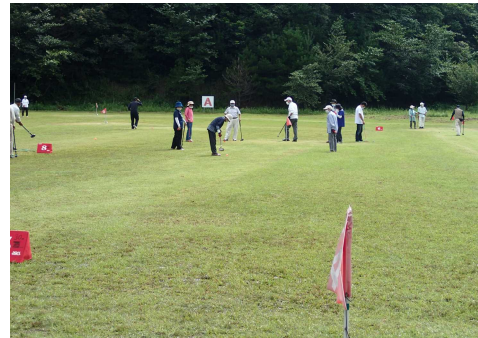
グラウンドゴルフ場の利用風景