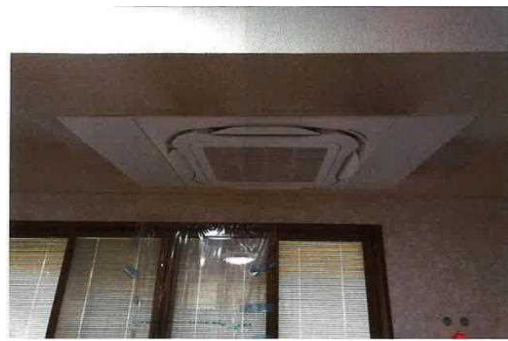
憩いの家空調設備改修後