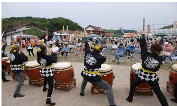
令和4年6月 イベント（こらぼのすけ）