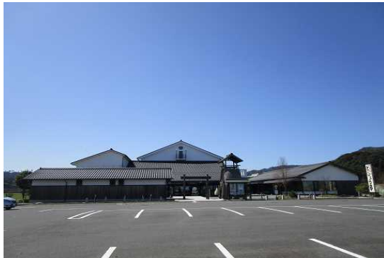
安来節演芸館（外観）