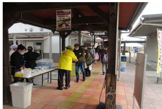
令和5年1月 だんだんふるまいデー