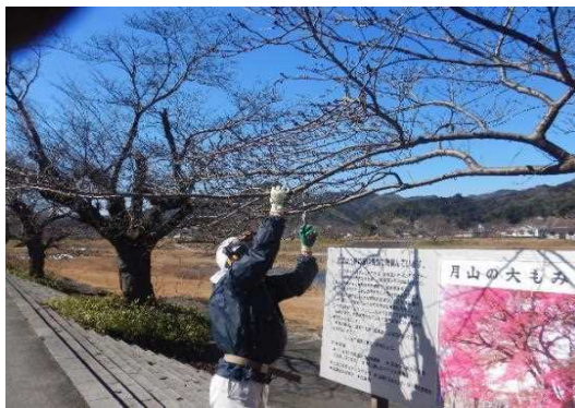
月山公園桜テングス病防除作業の様子