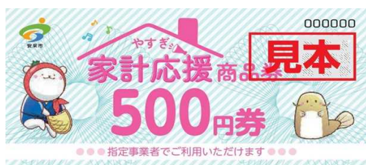
やすぎ家計商品券