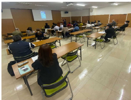
【独自事業】 デジタル化支援セミナーの様子