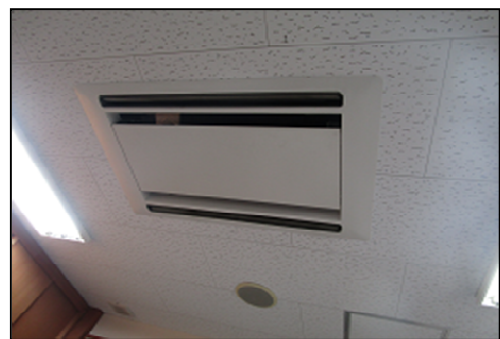
観光交流プラザ空調設備改修前