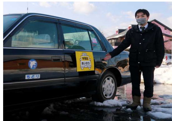
宇賀荘あいのりタクシーステッカー