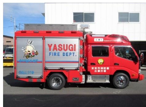
広瀬分署配備消防ポンプ自動車