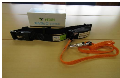
墜落制止用器具 29個