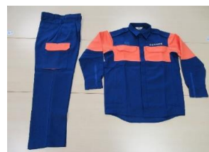
消防団員用活動服 40着