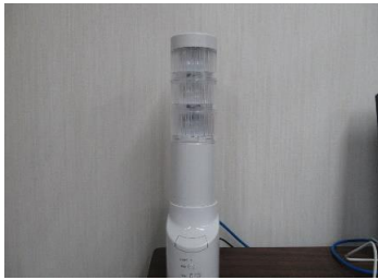
ネットワーク監視表示灯 1台