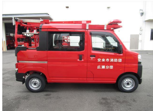
小型動力ポンプ付軽積載車（赤江分団、広瀬分団配備）