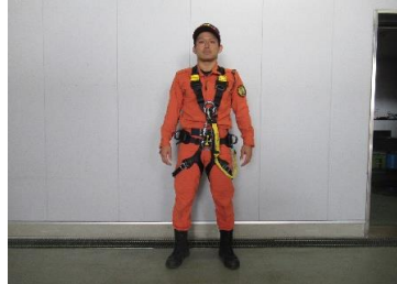
フルボディーハーネス 2器