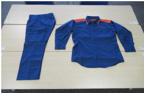
消防吏員用活動服 34着