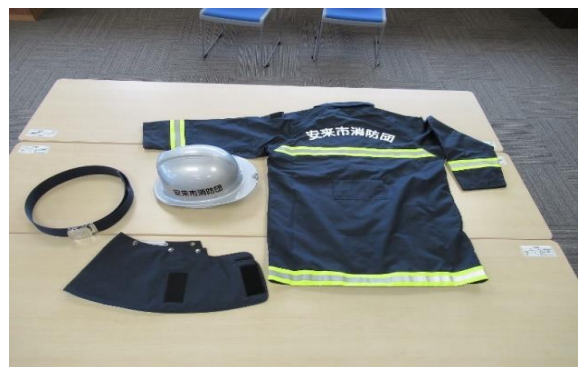
消防団員用防火衣 10着