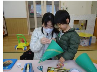
子育てふれあい広場の様子