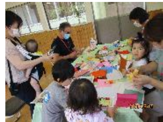
さわやかルームの様子