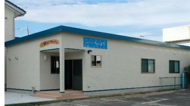
児童クラブ「たいよう」

【新型コロナウイルス感染症対策事業】 10,695,799円 10,695,799円 0円 0円 0円