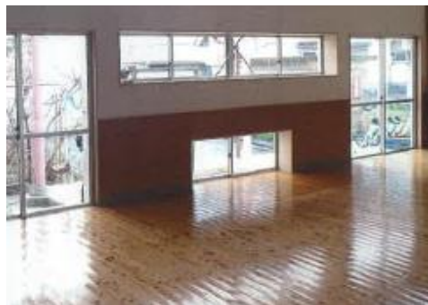
③認定こども園飯梨ガラス改修工事 (改修後)