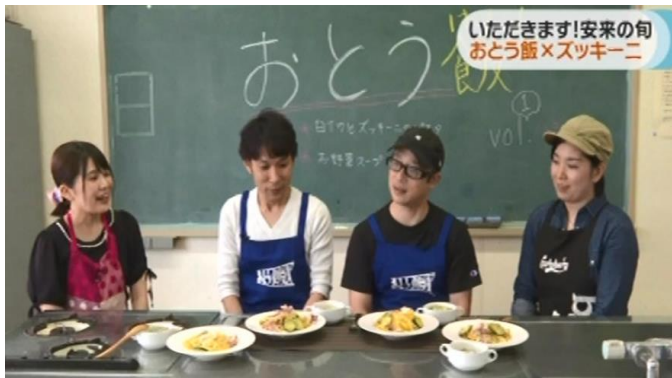
どじょっこテレビにて放映