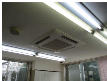
みゆき保育園大規模修繕

補助額 500,000円【総事業費 963,600円】 （財源内訳 県補助金 333,000円 一般財源 167,000円） 【保育対策総合支援事業費補助金 県2/3】