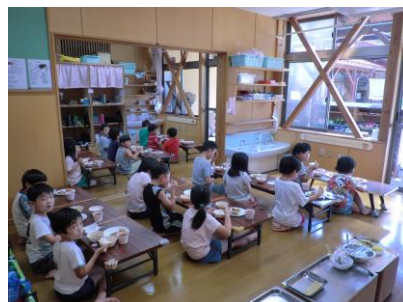
放課後児童クラブの様子