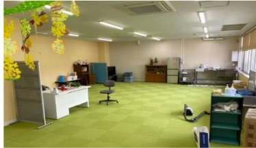
十神第2児童クラブ