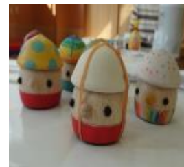
ふれあい広場の様子