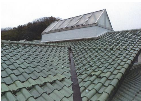
①認定こども園布部屋根改修工事 (改修後)