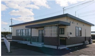
赤江放課後児童クラブ