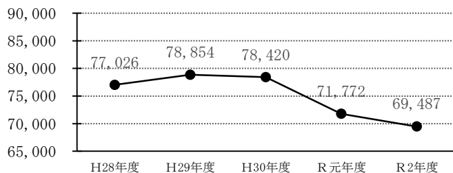
福祉医療費の推移