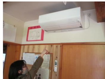
あゆみ保育園エアコン設置補助

【新型コロナウイルス感染症対策事業】 5,818,000円 5,818,000円 0円 0円 0円