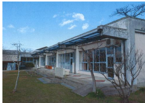
②認定こども園荒島第二園舎テラス屋根改修工事 (改修後)