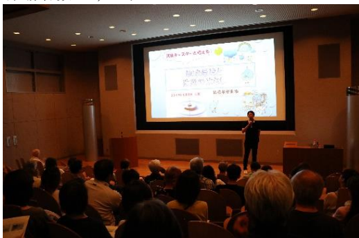
気象予報士「蓬莱大介」氏による講演会