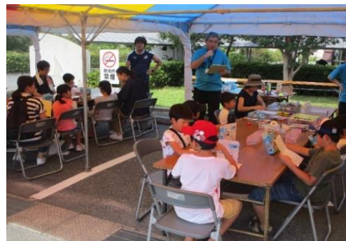
自然エネルギー教室