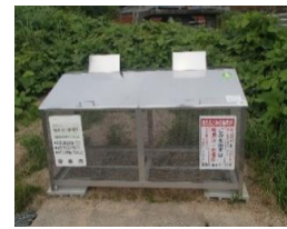
集積場補助事業活用による自治会の集積場

【分別の手引き作成業務】 2,255,000円 0円 0円 0円 2,255,000円