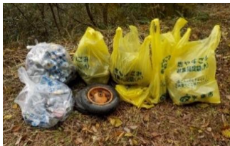
回収された不法投棄