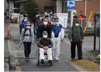
(右)原子力防災訓練