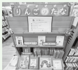
▲やすぎ図書館の「りんごの棚」

「りんごの棚」はじめました 「りんごの棚」とは、障がいのある子どもたちや、読書に困難を感じる人にも本を楽しんでもらえるよう、さまざまな工夫がされた本を集めたコーナーです。 大きな文字の本(大活字本)や、絵や写真を中心にした本(ＬＬブック)など、さまざまな種類の本をそろえています。子どもから大人まで、どなたでも利用できますので、ぜひご覧ください。 安来市立図書館の全館に、新しく「りんごの棚」を設置しました。