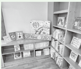
▲はくた図書室の「りんごの棚」