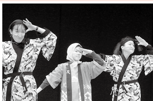
▲ダンス (NEO安来節・井尻小学校)