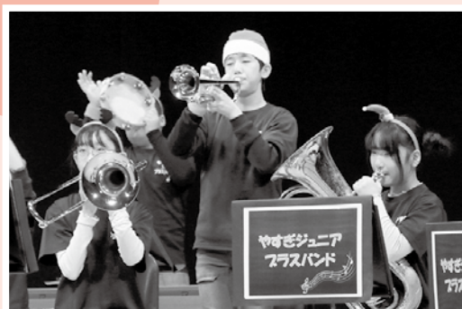
▲ブラスバンド演奏 (やすぎJr.ブラスバンド)