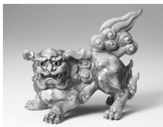
▲山本陶秀 備前焼『獅子置物』