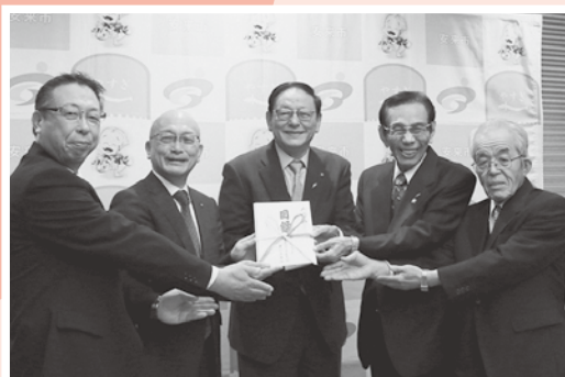
▲収益金 591,800 円は安来市共同募金委員会へ寄付しました。