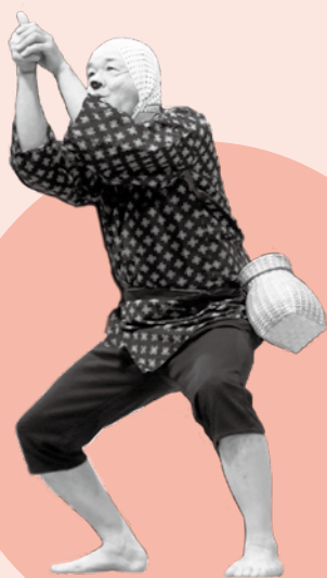
▲どじょうすくい (安来節保存会本部道場)

12月21日、総合文化ホールアルテピアで「第6回歳末たすけあい安来市民余芸大会」が開催されました。