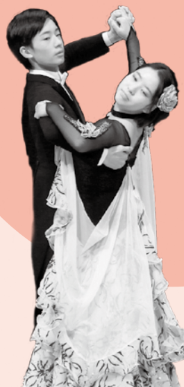
▲社交ダンス (バルホール)

個人・団体18組が出演。歌や楽器の演奏、踊り・ダンスなど多彩な芸がステージを彩りました。508人が来場し、多くの善意が寄せられました。