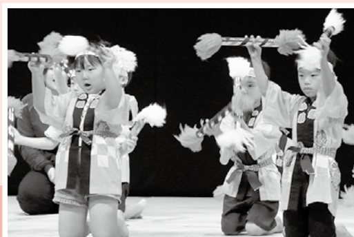
▲銭太鼓 (ふたばこども園)