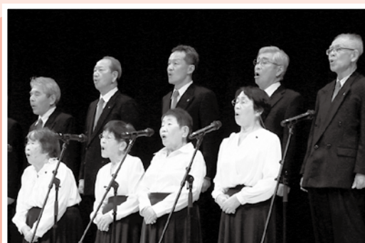
▲合吟 (清吟堂吟友会安来ブロック)