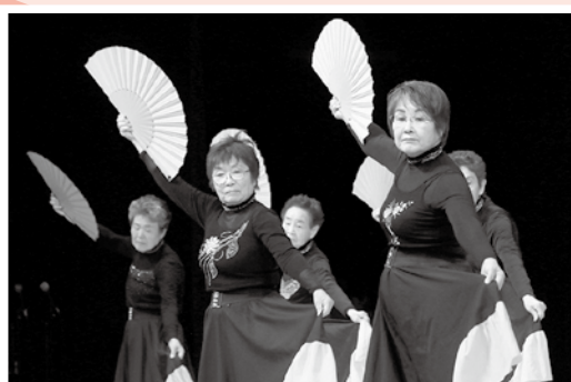
▲レクダンス (安来市フォークダンス連盟)