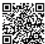
消防庁ホームページ 特設サイト