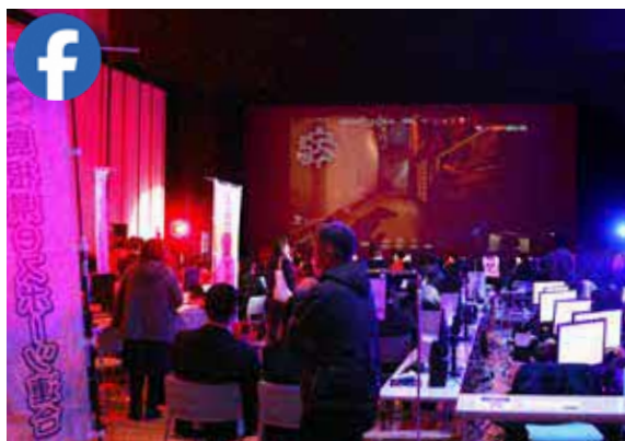
▲交流戦は会場中が注目。解説付きで、そのタイトルを知らない人も楽しく観戦できました。

メインイベントは、安来市の友好交流都市・台湾新北市新店区の莊敬専門学校生と、島根県内の高校生とのシューティングゲームによるオンライン交流戦。手に汗握る攻防の後には、言語の壁を超えて笑い合う友人たちの姿がありました。