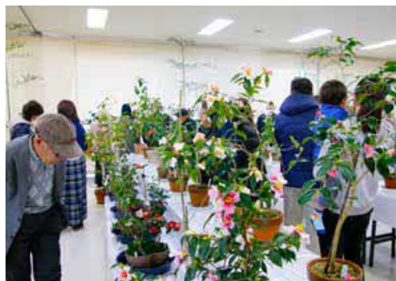
▲椿の苗木や椿油、椿クリームの販売も盛況でした。育て方のアドバイスを受ける人も。