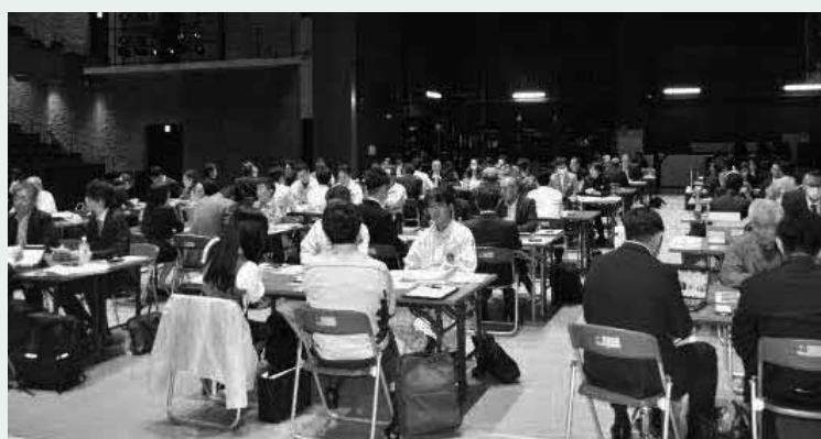
◀▲「ビジネスマッチング商談・展示会」の様子。