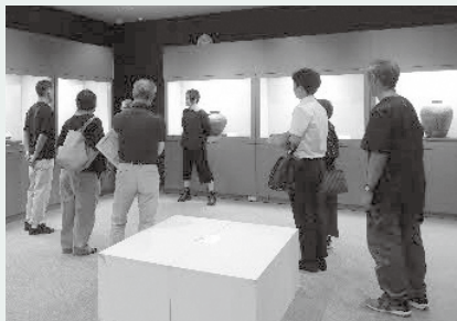
▲これまでに開催したアート de トークの様子。

各種定期相談は 市民カレンダーで 確認ください 相談は無料です。相談時 間・問い合わせ先は、次の とおりです。 行政相談 ▽9時～12時 ▽総務省島根行政監視行政 相談センター Tel 0852・21・3630 生活相談 ▽14時～16時 ▽サポステ松江