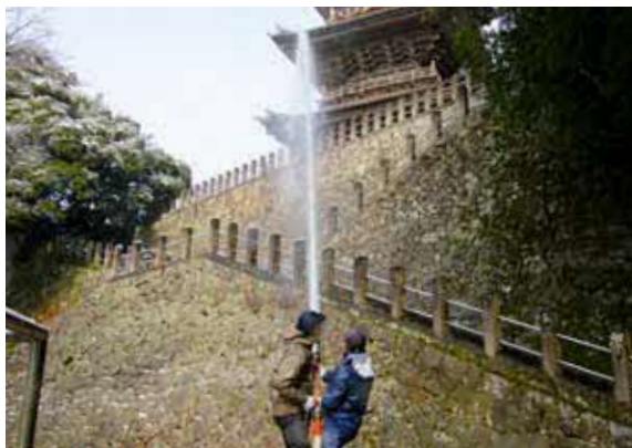
▲三重塔へ向けて放水訓練。清水自衛消防団は境内の旅館・土産店、お寺関係者で構成。