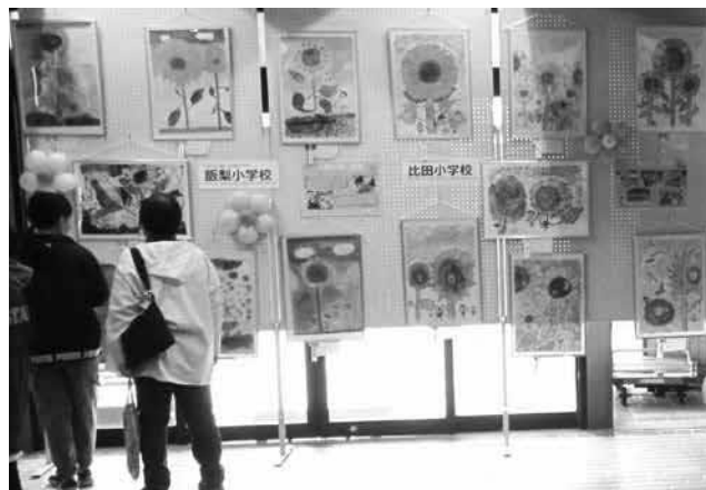
▲人権フェスティバル「つなげて未来や」の会場に展示した児童の力作を眺める来場者たち。

市内小学校では、2年ごとに順番で「人権の花」運動を実施しています。令和6年度から令和7年