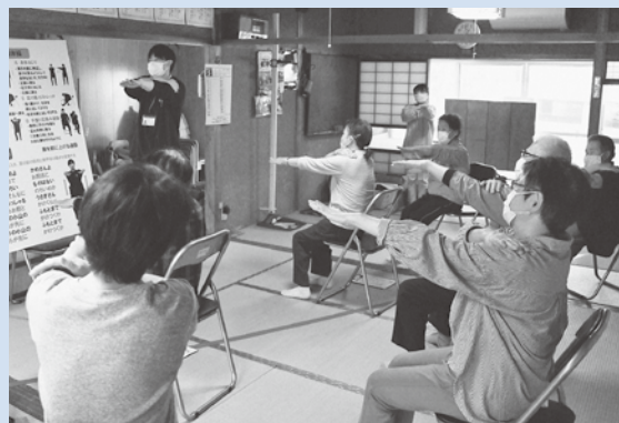
(「こけないからだ体操」の様子)