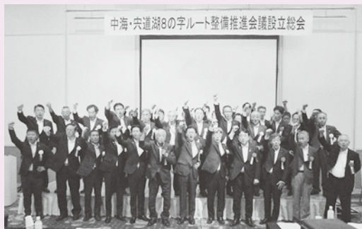
▲中海・宍道湖8の字ルート整備推進会議設立総会で、8の字ルートの整備推進を目指し一致団結する出席者。

近年、官民それぞれが、8の字ルートに係る勉強会を開催し、整備推進に向けた機運が高まったことから、8月7日に「中海・宍道湖8の字ルート整備推進会議」を設立しました。この組織は、中海・宍道湖圏域の5市や市議会、経済団体で構成され、国などへの要望活動や地域の皆さんへのPRを行い、早期の高規格道路網の完成を目指していきます。