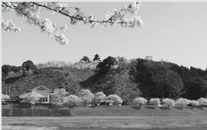
◀桜が咲き誇る月山富田城跡周辺。