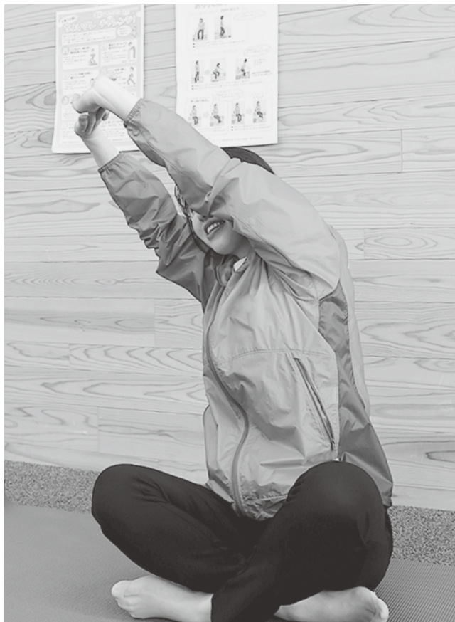
短時間でも運動する習慣を身につけましょう。