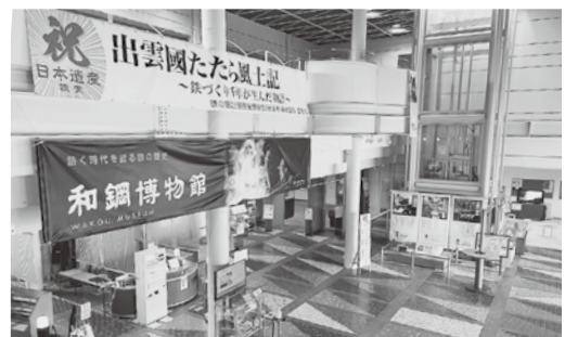
▲和鋼博物館では4月29日(金)祝～5月15日(日)に日本遺産の企画展を開催します。

なく紡がれています。安来市・雲南市・奥出雲町の3つのエリアにまたがるストーリーとして平成28年に日本遺産に認定されました。安来市とたたらはとても深い縁でつながっていますが、中でもたたらへの信仰、そして港町、安来節、大きな河川の下流部における新田開発、これらはいずれも安来市固有の誇るべき文化遺産です。来月号から構成文化財を紹介していきます。