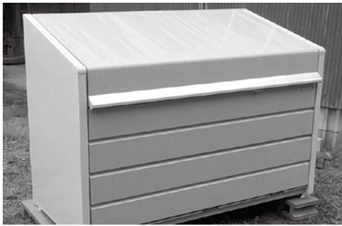
●環境政策課 Tel 23-3100

その他 ▽必ず事前に相談ください ▽市議会3月定例会議で令和4年度予算の議決が必要となります。