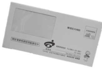
▲課税明細書は緑の封筒でお送りします。