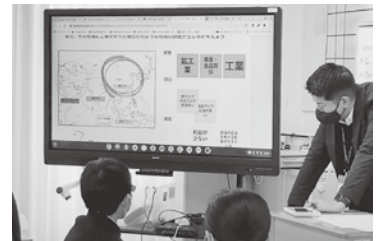
▲電子黒板を通してグループの意見を表示し共有。

担当の先生から生徒のタブレット端末に関係する複数の資料が送られ、生徒はそれの中から情報を選択し、個人の考えをまとめます。その考えをタブレット端末のコミュニケーション