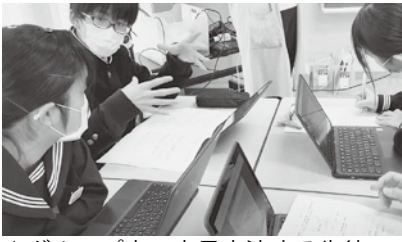
▲グループ内で意見交流する生徒。

第一中学校の2年社会科で「アジアの国々」を学ぶ単元の総まとめを行いました。急速な経済発展や人口増加により変化するアジア州の地域的特色を整理し、考えを深める授業。「アジアに進出する企業としてより有利な地域は？業種は？その理由は？」など、学習課題を掲げ進めていきました。