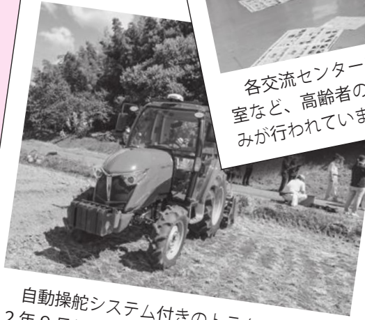
自動操舵システム付きのトラクター。令和2年9月に機械のデモンストレーションを市内のほ場で行いました。