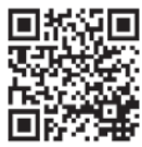
林業退職金共済事業本部