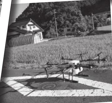
農業用ドローン。農薬の散布などに活用します。農業者の労働負担軽減が期待できます。