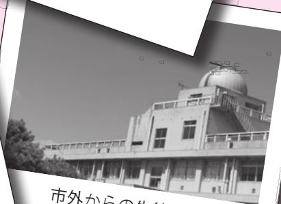
市外からの生徒の受け入れ拡大を図ります（写真は安来高校）。