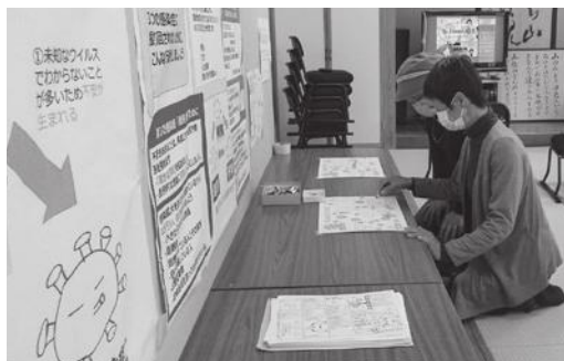
▲文化祭では、掲示物、じんけんすごろく、意識診断シートやDVD視聴で学びました。(下山佐交流センター)

|| 人権尊重社会の実現をめざして || 安来市人権・同和教育推進協議会の取り組み (地域部会)