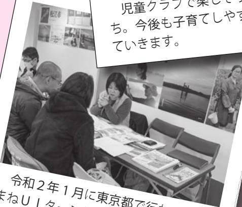
令和2年1月に東京都で行われた「しまねUターン相談会」。まちのPRに積極的に取り組んでいきます。