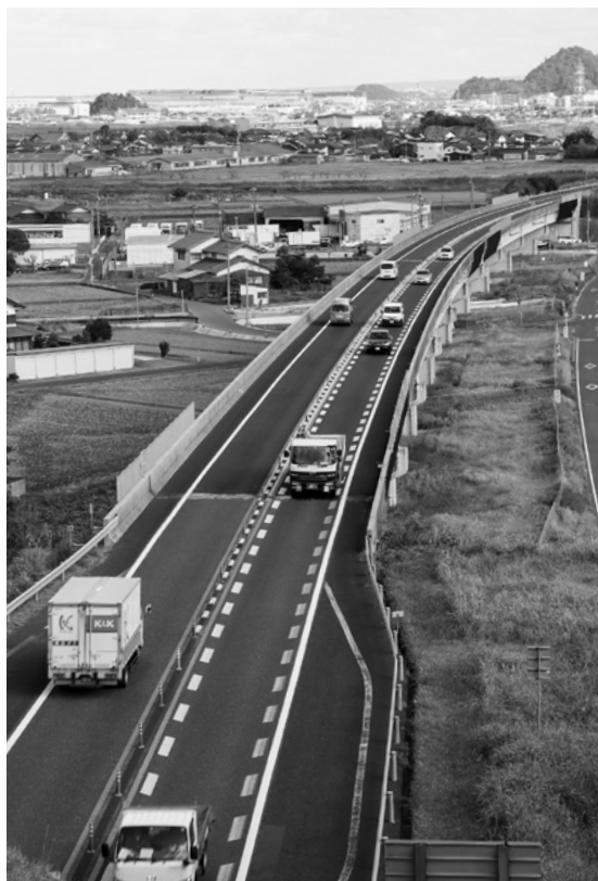
▲高速道路を活用して物流の効率化を図ります。