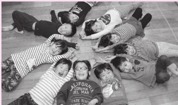
◀子どもたちが夢を描けるまちを目指します。

結びに新年が市民の皆さまにとって、幸多き年となりますよう、心からご祈念申し上げます。