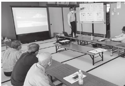
▲「コロナ禍と人権」の講話とグループワークを行いました。(飯梨交流センター)

全ての年代、地域の人に向けて人権啓発活動を展開している安来市人権・同和教育推進協議会。同協議会は、「団体・学校・保育部会」「企業部会」「地域部会」「行政部会」に分かれています。先月号の「企業部会」に続き、各地域の交流センターで組織する「地域部会」の活動を紹介していきます。 日頃から地域の人が集い、楽しみ、学び合う交流センターは、人権学習を提供する貴重な場にもなっています。 昨年度の活動では、講演会や