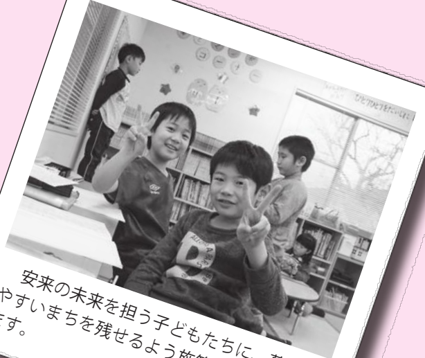
安来の未来を担う子どもたちに、暮らしやすいまちを残せるよう施策を進めていきます。