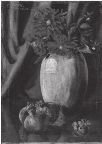
「ダリアとザクロ」 (1937年 油彩)