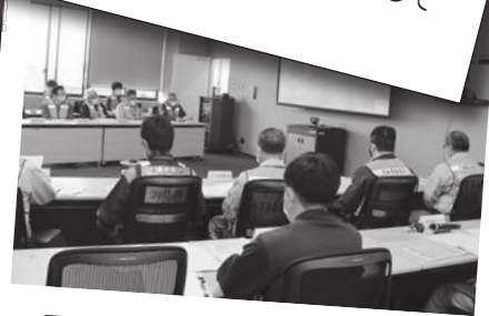
原子力防災訓練の様子。さまざまな災害に備えて、訓練などを実施していきます。