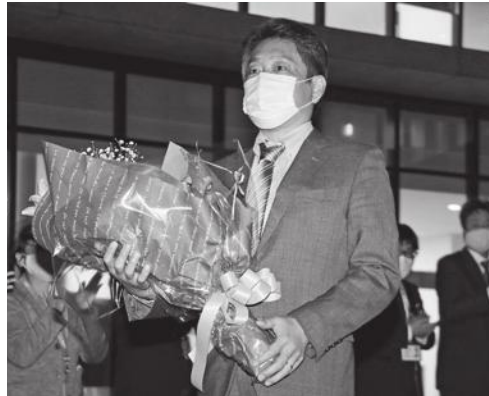
▶職員に見送られる美濃副市長。

美濃副市長が11月23日に退任されました。美濃副市長は平成31年4月1日に就任。島根県での行政経験を基にこれまで市政に尽力いただきました。