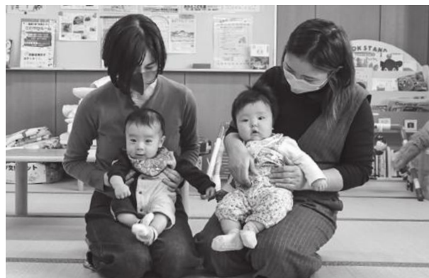
◀子どもを優しく見守るお母さん。