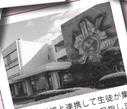
高等学校と連携して生徒が集う魅力あふれる学校を目指します（写真は情報科学高校）。