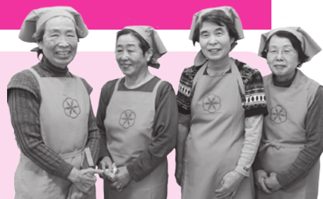
今月は伯太支部の皆さん

冬の野菜は、ベータカロテンやビタミンCが多く、免疫力アップや健康な皮膚・粘膜の保護、老化防止の効果が期待できます。