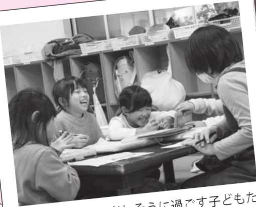
児童クラブで楽しそうに過ごす子どもたち。今後も子育てしやすい環境整備を行っていきます。