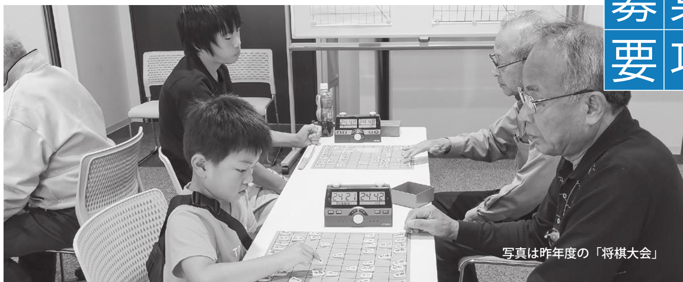
写真は昨年度の「将棋大会」