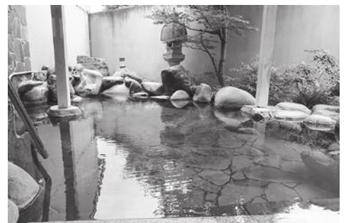
▲市内では、さぎの湯荘、竹葉、夢ランドしらさぎ、比田温泉 湯田山荘がスタンプラリーの対象です。

以上のスタンプを集める「湯めぐり入門コース」があります（応募期間は9月末日まで）。 そのほか、圏域内を周遊できる魅力的なキャンペーンを実施予定です。詳しくは、観光局のホームページをご覧ください。