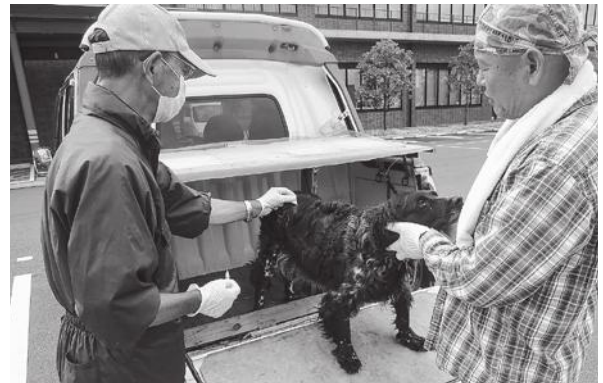
▲狂犬病予防注射の様子。市では、毎年、各地区で集合注射を実施しています。