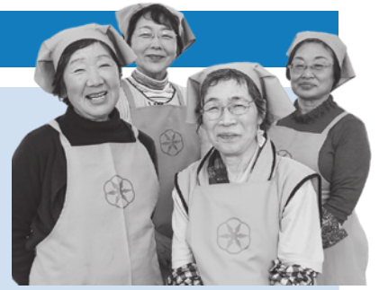
今月は安来支部の皆さん

新じゃがは、春先から夏場にかけて収穫されます。普通のじゃがいもに比べておよそ4倍のビタミンCを含んでいます。