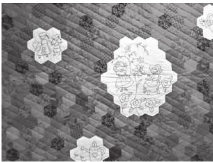
内藤和美「レッドワーク大好きなもの」(2015年・部分)