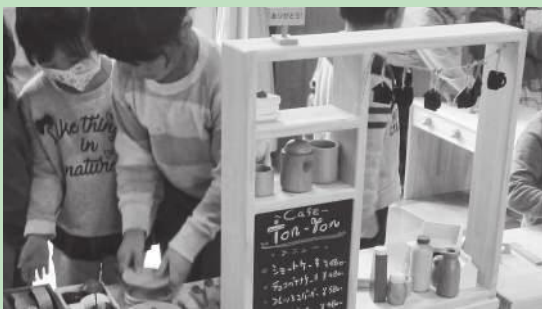
環境政策課 Tel 23-3098

※木育(もくいく)とは…子どもの頃から木に触れたり、木で何かを作ったりすることなどを通して木への愛着を深めるとともに、森林や環境に思いをめぐらせ、「木を使うこと」や「環境を守ること」の大切さを理解することを目的とする教育です。