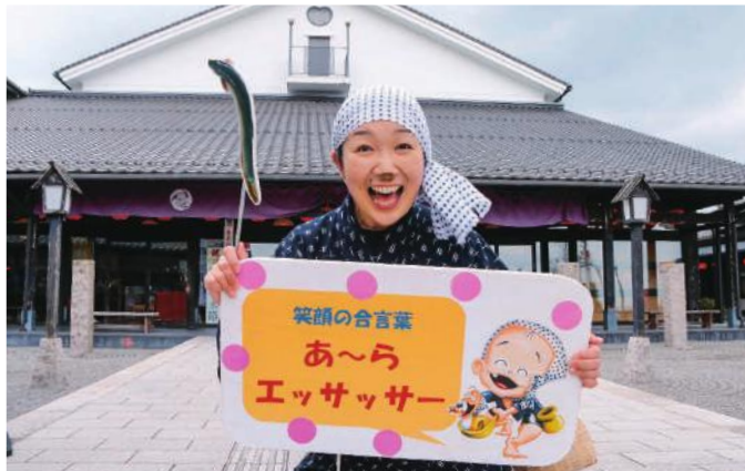
▲「きゅっきゅ」の由来はドジョウの鳴き声で、親しみを込めて名付けられました。本名より愛称で呼ばれることがほとんどか。