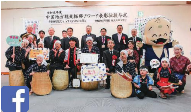
▲表彰を受けた出迎え隊と関係者の皆さん。