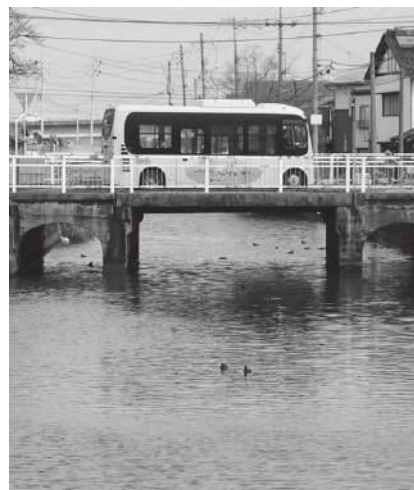
4月から安来駅＝竹矢（松江市）間をイエローバスは運行します。

【問い合わせ】 地域振興課 ☎ 0854-23-3069 広瀬バスターミナル ☎ 0854-32-2260