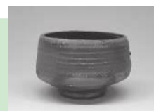
金重陶陽 備前焼「小袱茶碗」