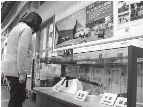
▶展示ケースは観光交流プラザの観光案内窓口の横に設置しました。