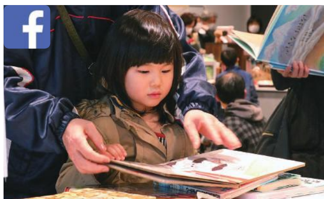
▲多くの絵本から好みの一冊を探す来場者。