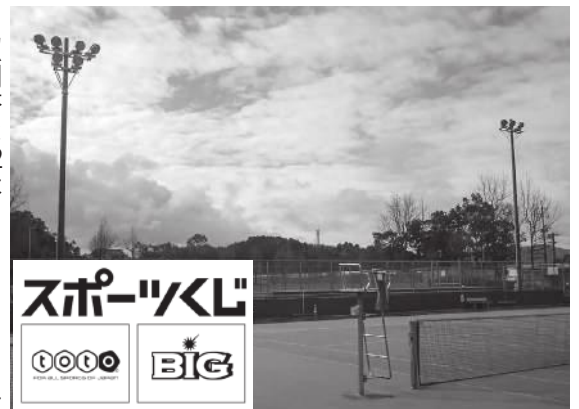
▶照明塔は12本あったものを6本にスリム化しました。

ナイター照明の改修は、独立行政法人日本スポーツ振興センターによるスポーツ振興くじ助成金を受けて行いました。