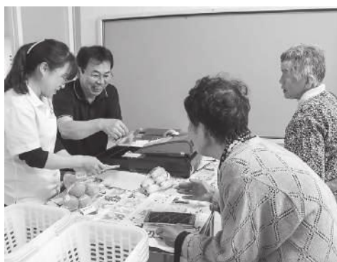
▲比田地区では高齢者の買い物を支援。

●地域の商業機能の維持を図るため、空店舗等への出店を促す目的で家賃補助や改装費補助を行います。また、中山間地における店舗整備および移動販売車購入補助を実施し、商業機能の維持・向上を図ります。