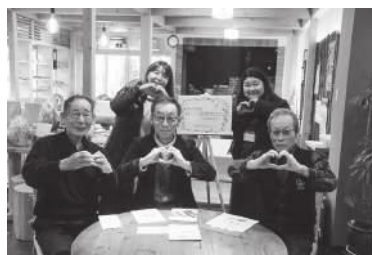
◀ 市内のはぴこ相談員で構成する「安来はぴこ会」と関係者の皆さん。