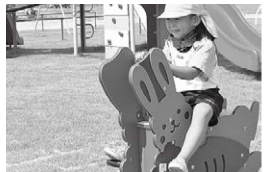
▲スウィング遊具の可動部は指の挟み込みがないようロック式です。