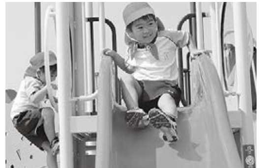
▲滑り台は年齢に合わせた4種類が合計8台設置してあります。