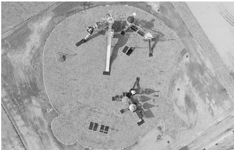
▲上から見るとエッサくんが現れます。