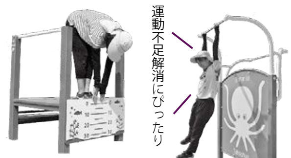
▲健康遊具は全部で7種類。腹筋やジャンプ力を測る器具などがあります。