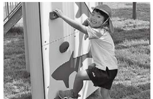
▲多彩なアイテムが連続し遊びごたえ満載です。写真はクライミング。