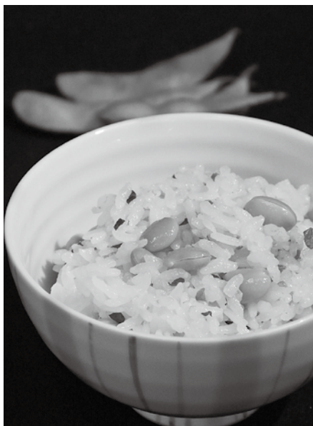
栄養たっぷりの枝豆で暑さを乗り切ろう