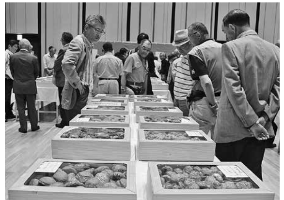
▶平均気温や降水量が品質や生産量に大きく影響します。

近年は寒暖差や降雨等の極端な気象条件のため、規格品を揃えることが難しい状況。それでも優秀賞のものは、品揃えや規格ごとの特徴が良く表れていたことが評価されました。