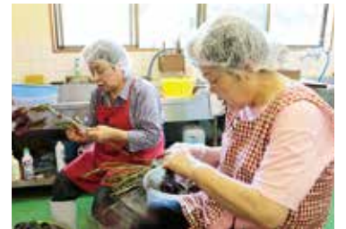
▲梅のかりかり漬けは毎週、木曜日に広瀬グリーンセンターで販売される予定です。

現在、仕込み中の通称梅カリは8月初旬頃から販売が開始されます。今年の夏も菅原の梅が、私たちに清涼感を与えてくれそうです。