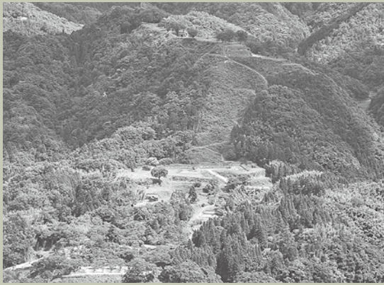
▲京羅木山から撮影した月山

中国地方を代表する山城である月山富田城の魅力について、お城研究の第一人者としての観点からお話いただきます。