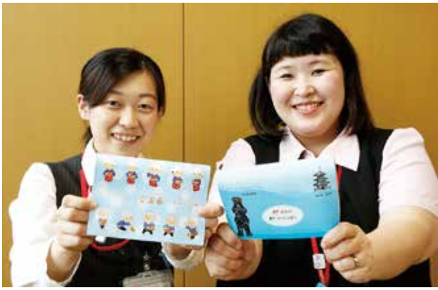
▲市内郵便局で新規口座を開設した人に配布されています。