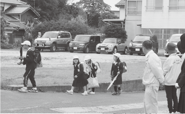
(写真) 民生・児童委員の活動。(上) 子どもたちの見守りは大切な活動。(右) 赤い羽共同募金活動に協力します。