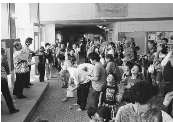
▶ロビーでは餅まきなどが行われました。

イベントでは、飯梨郷ふれあい太鼓保存会の演奏やガールズユニット「kotono no ha」のライブ、プール割引サービスなどがあり、多くの人でにぎわいました。