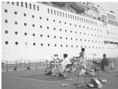
▲クルーズ船の歓迎では安来節を披露しています。

③クルーズ客船寄港時のおもてなし 圏域5市が協力して、乗船客向けの交流イベントや観光案内を行っています。今年は12月末までに63回のクルーズ船が寄港予定です。