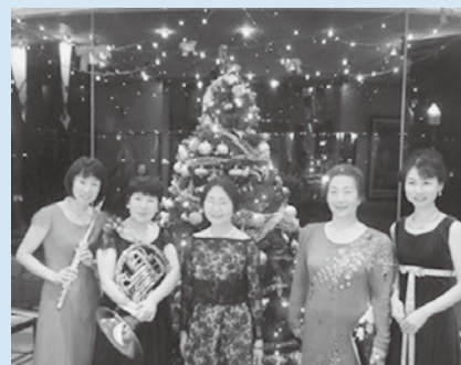
エリザベトフレンズ松江の皆さん