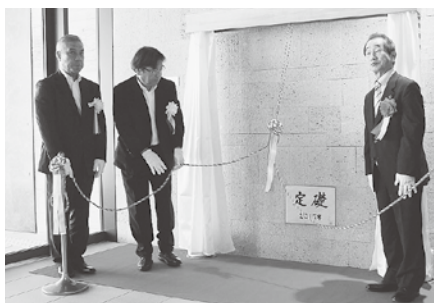
◀アルテピア竣工式で定礎板を披露する近藤市長（右）