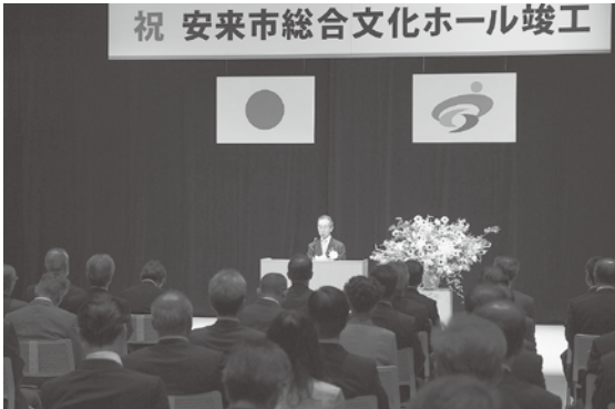
祝 安来市総合文化ホール竣工

問い合わせ：総合文化ホール ☎ 21-0101 イベント情報はホームページ http://www.artepia.jp/