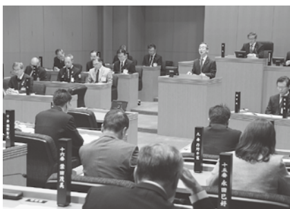
◀12月1日、市議選後の定例会が開会しました。