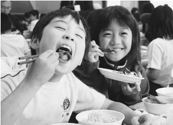
▶途中では当番さんが食材の特色や提供者などの紹介をしていました。