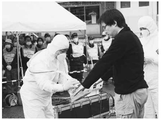
▶放射性物質の付着を調べる検査「退域時検査」も実施。

参加者は、自宅から交流センターへ徒歩で移動し、バスで30キロ圏外に避難するまでを想定した訓練を行いました。また、車で避難したときに避難地で行う車両の放射線測定や車の除染、乗車していた人の簡易除染などを見学し、原子力災害時の避難について理解を深めました。