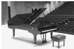
▲アルテピアノに設置されたスタインウェイ&サンズ社のピアノ。

館長 今、アマチュアの方の音楽公演とか、ピアノ教室の発表会などにぜひふん下見にいられてください。一流のスタインウェイを子どもに一回弾かせたいという方も来られます。こういった一流のモノに幼い頃から出会うことが子どもたちにとってとても大切なことです。