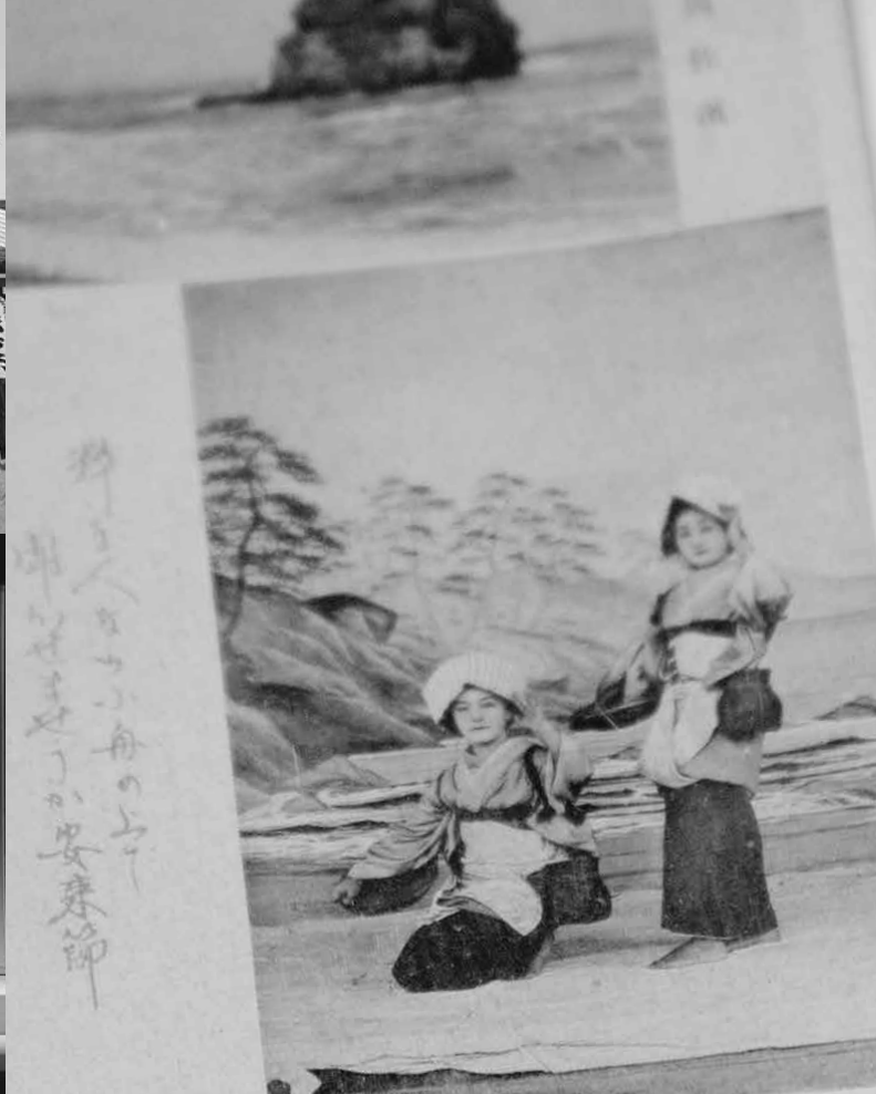
(右) 昭和初期の島根の観光用ハガキ。県内の観光地とともに安来節どじょうすくい女踊りの衣装を着た女性が写っています。(上) 平成29年10月10日に東京・浅草寺で安来節の奉納公演を行いました。(下) 総合文化ホール開館セレモニーでの安来節の様子。(9月9日)