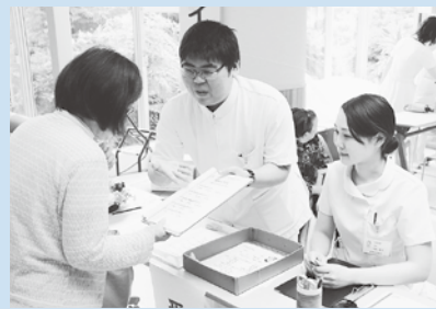
▲定期的な健康診断で健康的な生活習慣を心がけましょ。