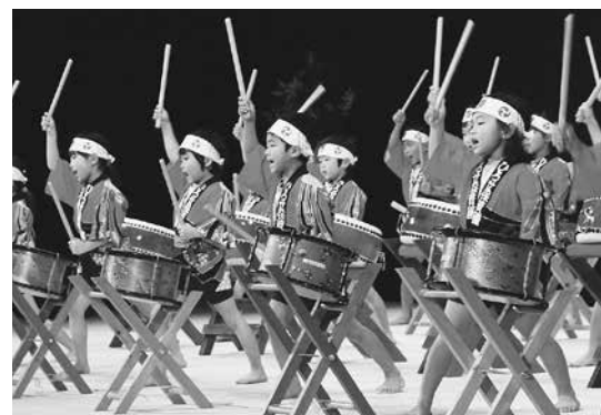
▲子どもたちもステージに立ち、貴重な経験を積みます。

市長 そうですね。芸術文化は順に慣らせていくのではなく、一流ものを見て、いい物に触れること