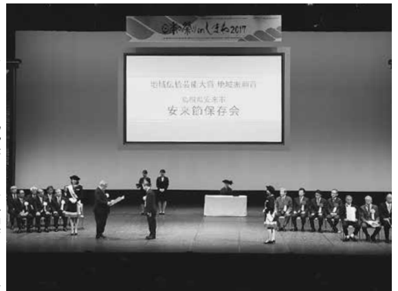
▶高円宮妃殿下のご臨席中の表彰を受ける近藤市長。

市では地元食材を使った給食を提供しており、また、毎月3回程度はドジョウや梨などの特産品を採り入れています。