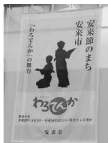
▲市はPR用の懸垂幕を設置しました。

治く昭和初期が舞台のドラマです。ストーリーは、ヒロインが夫婦で寄席経営を始め、ついには日本で初めて「笑い」をビジネスにした女性と言われるまでになる物語です。