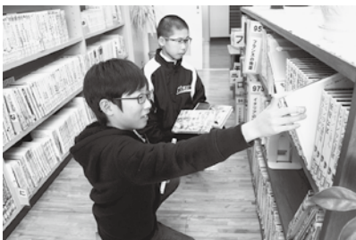
◀学校図書館で本を選ぶ児童のみなさん(宇賀荘小学校)

島根県では、平成21年度から「子ども読書県しまね」というキャッチフレーズで、図書館活用を通して本に親しむことを目指しています。市では、それ以前から文部科学省の補助事業を活用するなどして、学校図書館の充実を図ってきました。平成22年度には市内全ての小中学校に学校司書