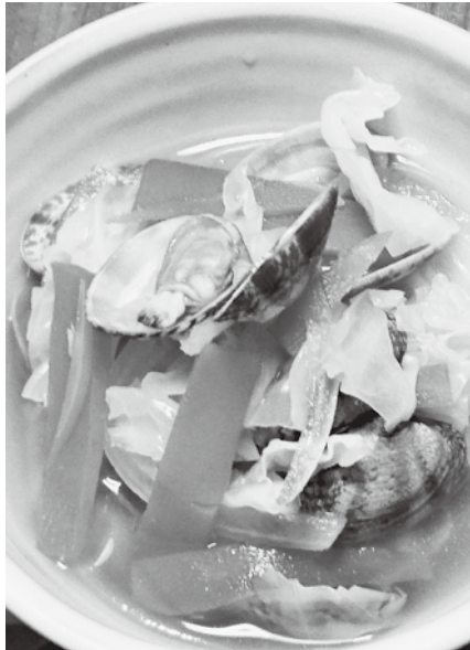
あさりのうまみと野菜の甘みで おいしくいただけます。