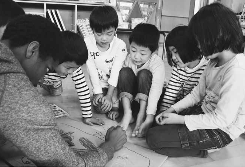
▲今年度から全ての幼稚園・保育所・認定こども園に外国人指導助手を派遣。幼児期から国際感覚を育てていきます。

民の皆さんとの公約の実現に全力で取り組んできました。3大事業をはじめ将来に向けた基盤整備などその多くに一定の道筋をつけることができました。 とくに、安来庁舎、総合文化ホールなどは、多彩な文化を育んできた安来市の新たなシンボルとなるものです。これらを核として更なる市民サービスの向上に努めていきます。 人口減少社会での地方都市を取り巻く環境は、中山間地域・中心市街地などをはじめ、喫緊に対応しなければならぬ課題が山積