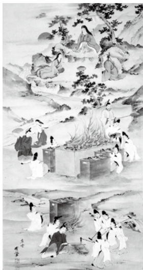
▲金屋子神図 (堀江有声作・部分) 和鋼博物館蔵。