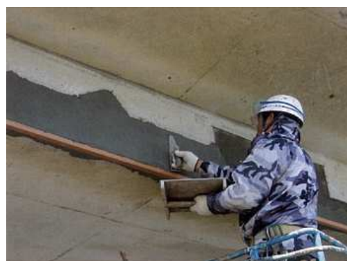
写真 1-3 断面修復状況