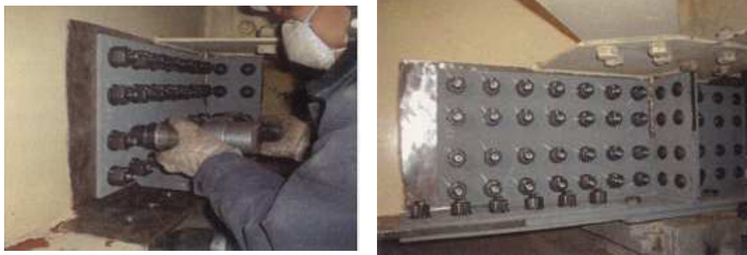
写真 1-1 当て板工実施状況

激しい腐食による鋼部材の減厚が生じた箇所に対し、腐食箇所を取り囲むように当て板（添接版）を施すことにより鋼部材を補修する工法です。