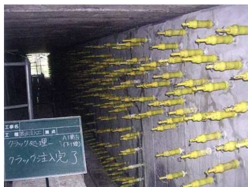
写真 1-2 ひび割れ注入状況

ひび割れを塞ぐことにより、劣化因子（水分、塩化物など）の侵入を防止し、コンクリートの耐久性を向上することができます。