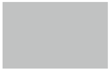
写真キャプション