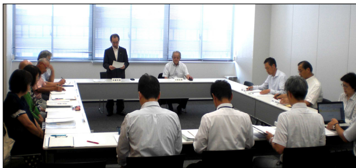
審議会における諮問 《第1回・令和元年8月2日開催》

諮問機関である「安来市行政改革審議会」では、令和元年8月2日に市長から第4次行政改革大綱の策定について諮問を受け、これまでの実施計画の実績等を踏まえ、計4回の議論が重ねられました。