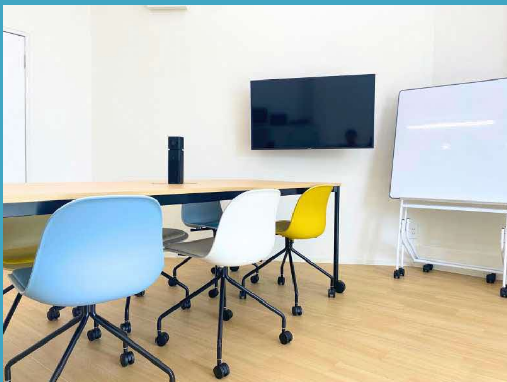
会議スペース (6人掛)