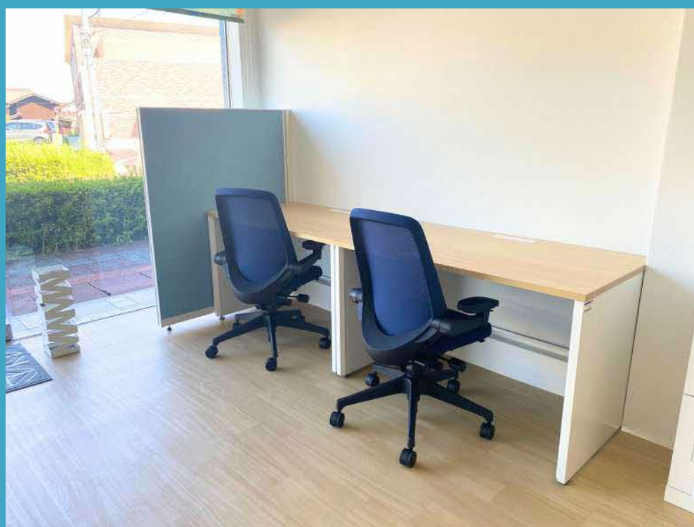
オフィススペース 3席