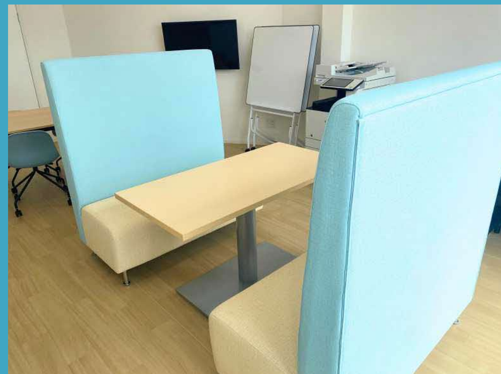
応接スペース (4人掛)