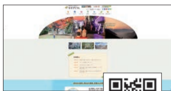
定住支援サイト やすぎぐらし