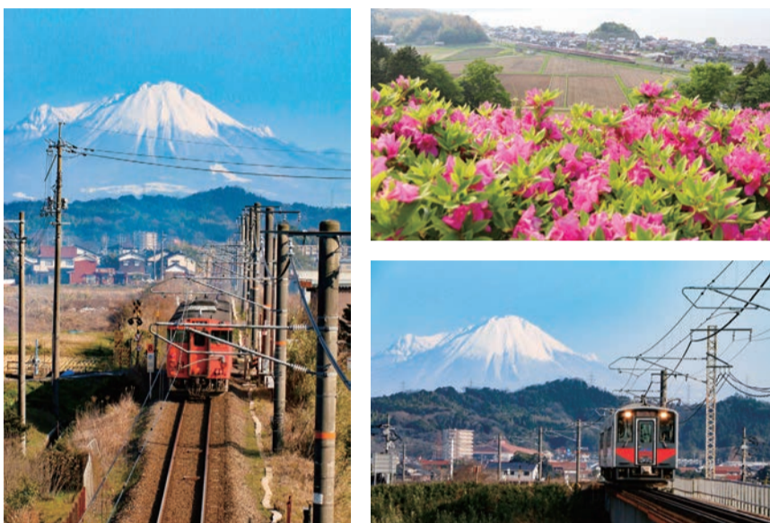
(左)撮影地：荒島町の陸橋から (上)撮影地：古代出雲王陸の丘から(荒島町) (下)撮影地：赤江町の鉄橋 ※撮影の際はルールを守りましょう。

左の写真はまっすぐ続く線路上に大山が見えます。特急やくもの「上り」でこの風景が見えるとこれから県外に行くんだなという気になります。逆に「下り」で見えてきたならば故郷に帰ってきたなあと実感しますよね。(の)