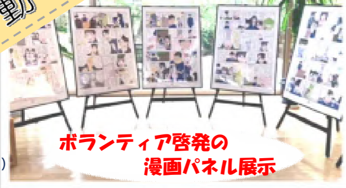
ボランティア啓発の漫画パネル展示