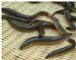
安来市の花・木・鳥・魚