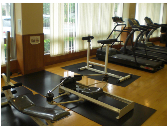
(トレーニングルーム)