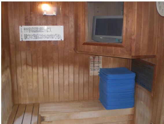
(浴室 (サウナルーム))