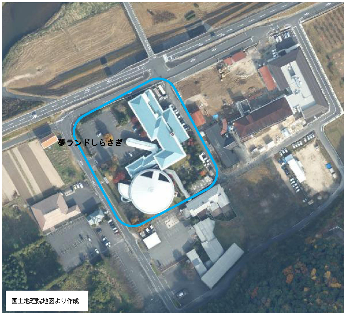
〈夢ランドしらさぎ〉