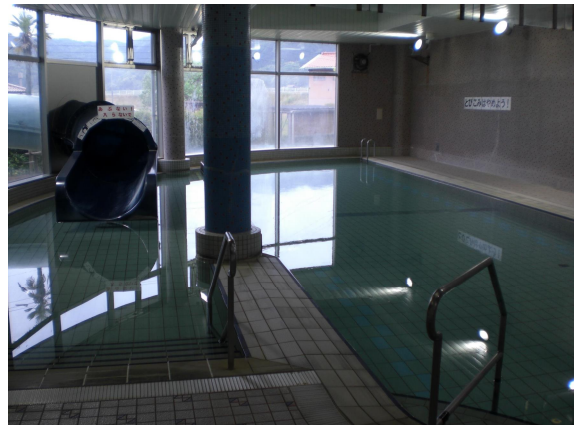
(ウォータースライダー)