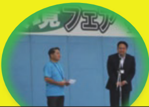
「レジ袋販売収益金贈呈式」やすぎ環境フェアにて