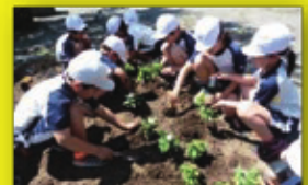
安田小学校の環境活動の様子