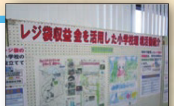
小学校環境活動の取り組みを 事業者店舗で展示しました！