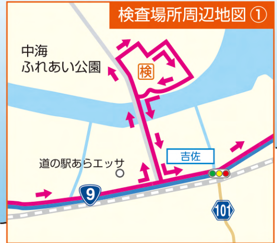
検査場所周辺地図①