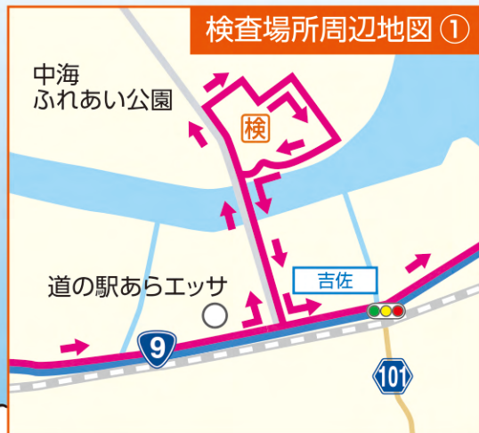
検査場所周辺地図①