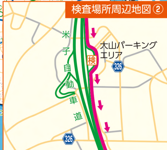
検査場所周辺地図②