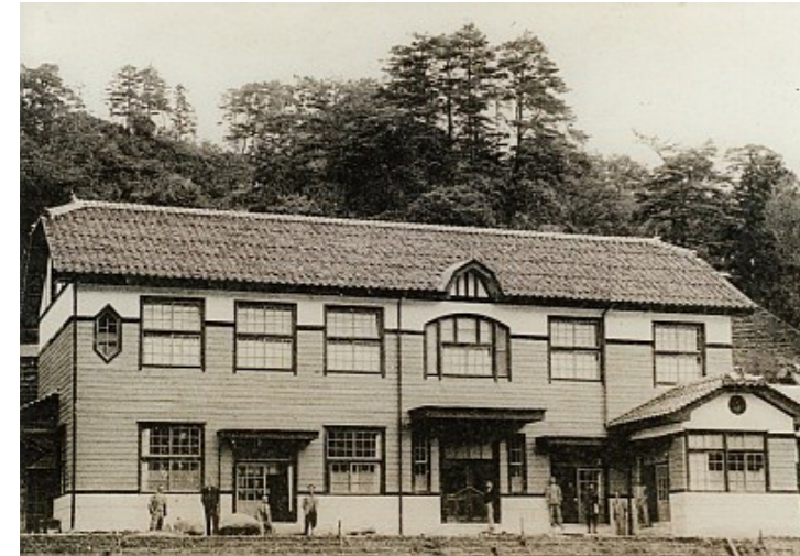
所となり、この中に山佐公民館が設置されていた。参考にした資料は広瀬町発行の「合併40年のあゆみ」

この疑問をよく耳にしますので、資料に基づき分かる範囲で解説してみたいと思います。山佐公民館は昭和30年に設置されました。当時は昭和の大合併が行われた年で、合併前の旧山佐村内の各地域（西谷、奥田原、上山佐、下山佐）に公民館はなく、その4地区を網羅する形で山佐公民館が設置されたものと思われます。昭和44年に上山佐以外の3地区に「分館」が設置され、その後時期は不明ですが3つの分館も正式な公民館になりましたが、山佐公民館の名前は引き続き使われ、更に平成19年に交流センターに名称変更されて現在に至っています。