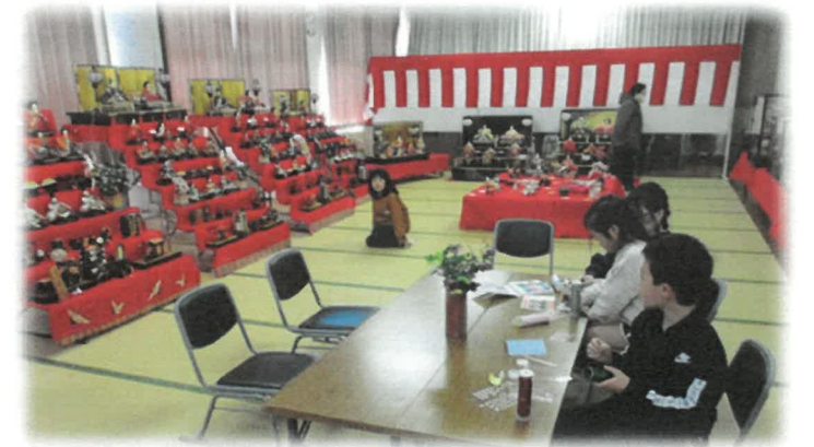
オリジナルの万華鏡作りを楽しみました。

宮上ミニサロン四つ葉会のみなさんへの作品です。毎年展示に花を添えてもらっています。