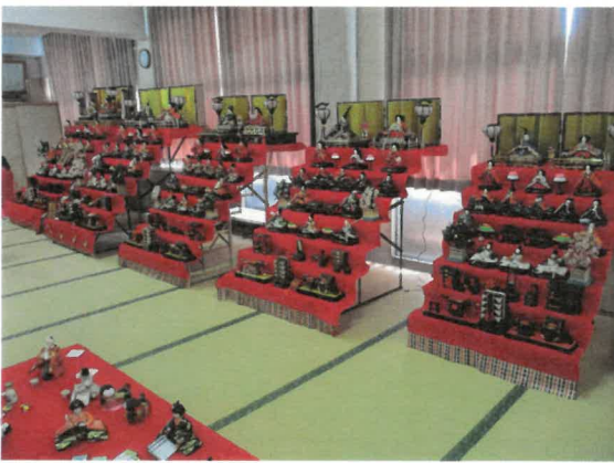
段飾りも一同に並び見事でした。

地域のみなさんからお預かりしているおひな様や天神さん、五月人形などを一堂に展示し、うなみの里のひなまつりを開催しました。段飾りの他にケース入りの人形や、掛け軸など展示しました。中には遊び心を交え、お花見や百人一首、たこあげや鞠遊びなどしている様子もあらかし、たくさんの方々に来場していただき観ていただくことができました。また、オリジナルの万華鏡が作れる工作コーナーも設け、童心にかえって楽しんでいただけたのではないのでしょうか。