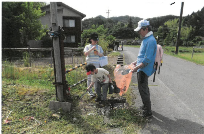
ゴミをひろって楽しくウォーキング! きれいになりました。