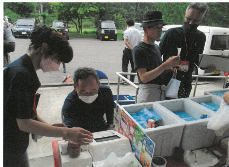
骨の健康チェック! さあ、あなたの骨密度は・・・???