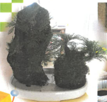
加藤恒夫さん作 「岩松」